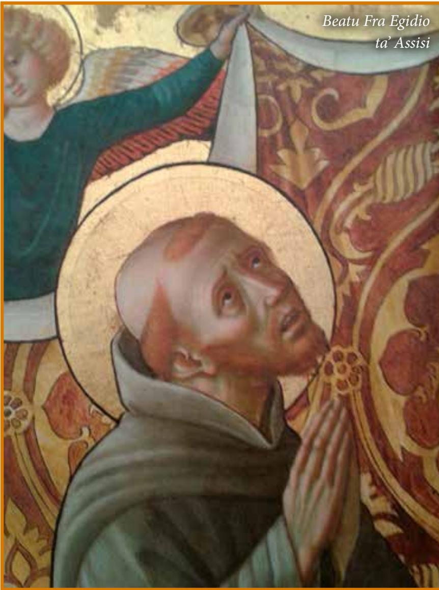
Beatu Fra Egidio ta' Assisi

‘Min irid jixtri l-ilma?’ U kien jgħix b’dak li kien jiddobba. Imbagħad qasam il-baħar, u b’devozzjoni u qima żar il-qabar tal-Mulej u wkoll il-postijiet l-oħrajn li kien xtaq jara. Waqt li kien jgħix fil-belt ta’ Akri hu kien jithabat biex jgħix bil-hidma tiegħu. Kien jaħdem il-qasab li kienu jużaw in-nies f’dak il-post. Meta ma kienx ikun jista’ kien jittallab il-karità bieb bieb. Imbagħad reġa’ lura lejn Santa Maria tal-Porziuncola mal-patrijiet” ( Storia della vita del beato Egidio (Vita Perugia) , 4, traduzione di S. BRUFANI, in Fonti Agiografiche dell’Ordine