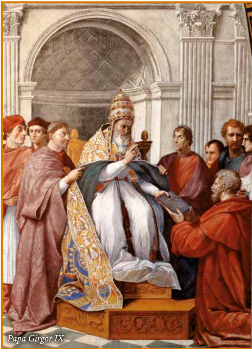
Papa Ġirgor IX

San Frangisk, kienu 12, 6 fl-Italja u 6 'l fuq mill-Alpi u 'l hemm mill-baħar: (1) Tuscia (Umbria u Toscana), (2) Marche, (3) Lombardia, (4) Terra di Lavoro (Napli), (5) Puglie, (6) Calabria (u Sqallija), (7) Oltremare (Sirja), (8) Spanja, (9) Franza, (10) Provence, (11) Ġermanja (u Ungerija), (12) Ingilterra (H. HOLZAPFEL, Manuale Historiae Ordinis fratrum Minorum , Friburgi-Brisgoviae, 1909, 142).