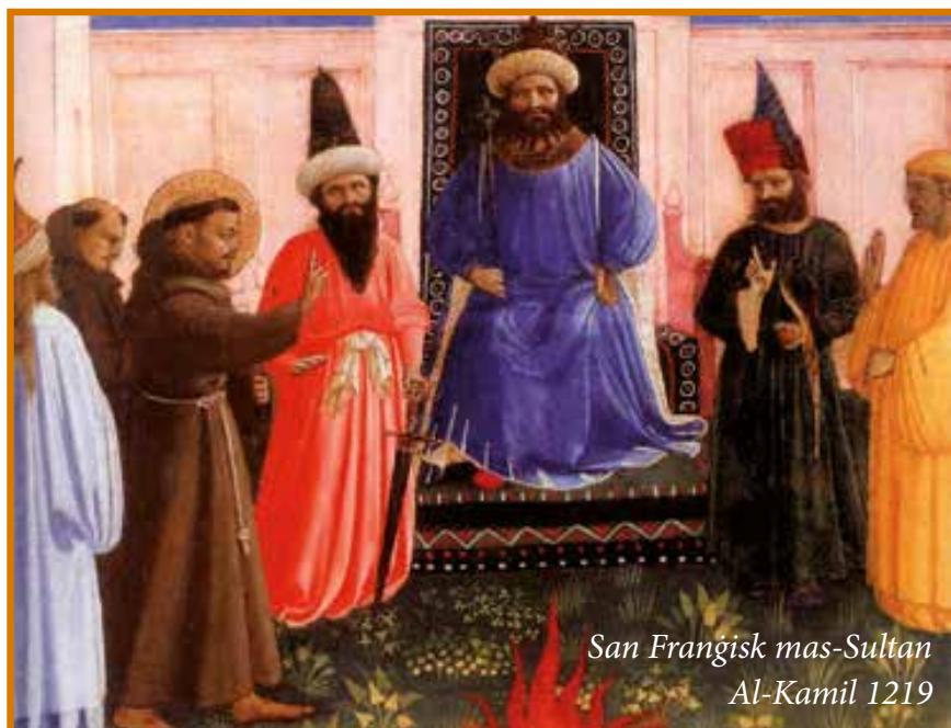
San Frangisk mas-Sultan Al-Kamil 1219

B'hekk fl-1229 il-Patrijarka ta' Ġerusalem Gerald ta' Lausanne (1225-1239),