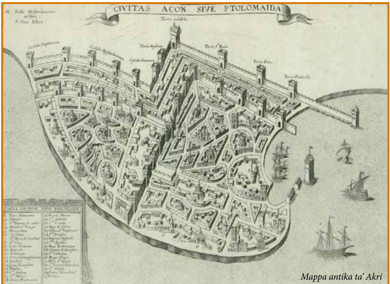
Mappa antika ta' Akri