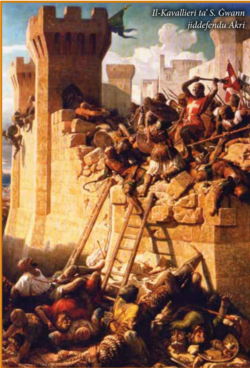
Il-Kavallieri ta' S. Ġwann jiddefendu Akri

“GIRGOR, Isqof, Qaddej tal-qaddejja ta' Alla. Lill-Venerabbli Hutna l-Patrijarki ta' Antjokja u Ġerusalem, u Legati tas-Sede Apostolika, lill-Arcisqfijiet, Isqfijiet, u maħbubin uliedna Abbati, Prijuri, Prepositi, Dekani, Arcidjarki, u l-Prelati l-oħrajn Ekkleżjastiċi, li lilhom tasal din l-Ittra, Saħħa u Barka Apostolika.