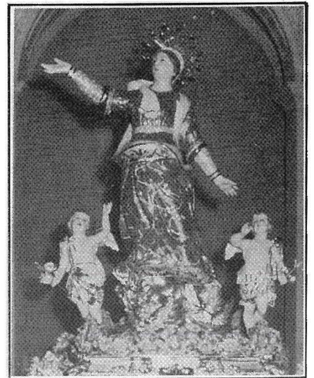
L-Istatwa tal-Madonna meqjuma fil-Parroċċa ta' Had-Dingli.

Kemm ippenetrat din id-devozzjoni fit-tradizzjoni reliġjuża ta' pajjiżna jidher mill-fatt li sa l-ickien parroċċa li eżistiet sal-bidu tas-seklu XVII kollha kellhom jew xi