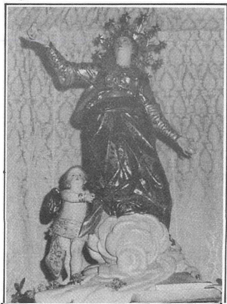
L-Istatwa tal-Madonna meqjuma fil-Parroċċa ta' Hal Ghaxaq.

jew ta' Għadir il-Bordi kif ukoll żewġ knejjes oħra li darba kellhom din l-istess dedika; illum huma ta' San Pietru u tal-Belliegha b'titlu tat-Twelid tal-Madonna; knisja oħra fil-istess parroċċa dedikata lill-Assunta hi ta' Marin id-Dona. F'Hal-Luqa hemm il-Knisja żghira tal-ftajjar, fil-waqt li kemm l-Imġarr kif ukoll il-Mosta il-parroċċa hi dedikata lil Santa Marija. Fil-limiti tal-Mosta, fit-triq lejn l-Imdina, imbagħad hemm il-kappella ta' Żejfi, fil-waqt li knisja oħra f'dan ir-rahal, dik ta' dhib, illum tal-Viżitazzjoni, darba kienet tal-Assunta. Fl-Imqabba il-festa tal-parroċċa hi Santa Marija; f'dan ir-rahal ukoll hemm knisja, dik tad-Duluri, li darba kienet ta' l-Assunta. Fil-limiti tan-Naxxar, dik ta' Hal Misilmet jew tax-Xagħra, li illum nafuha b'tal-Grazzi, darba kienet dedikata lill-Assunta; tant hu hekk li l-festa għadha ssir sal-lum fil-15 t'Awissu. Fil-limiti ta' l-istess raħal hemm ukoll dik tal-Mghatab. Fil-limiti ta' Hal Qormi nsibu dik tal-blat jew tal-wied, dik ta' Qrejqċa, il-famuża knisja ta' Ħlas, kif ukoll dik tas-Samra jew ta' Atoċja, illum parti mill-Hamrun. Mill-knejjes ta' Santa Marija li ntemmu f'Hal Qormi kien hemm