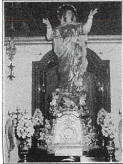
L-Istatwa tal-Madonna meqjuma fil-Knisja ta' Samra.