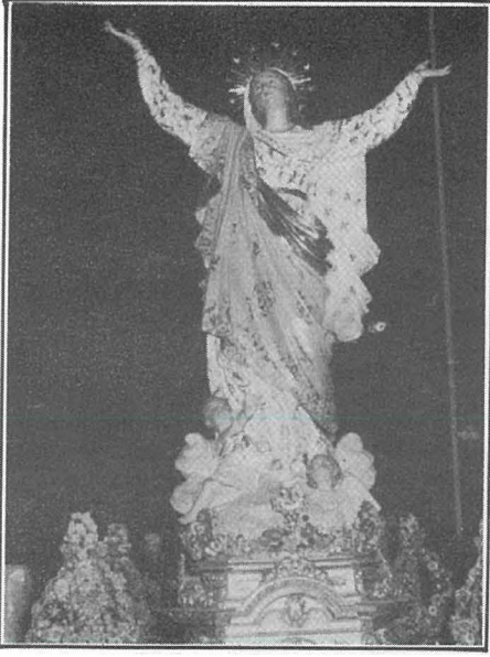
L-Istatwa tal-Madonna meqjuma fil-Parroċċa ta' l-Imġarr.

X'baqa' illum minn dan l-ghadd kollu ta' knejjes u kappelel medjevali? Mhux wisq, billi hafna ma baqghux jiehdu hsiebhom u gew iprofanati kanonikament, aktarx fis-seklu XVII. Minn dawk li baqghu, kien hemm ohrajn li bidlu d-dedika taghhom. Dawk li ghad hemm illum huma: f'Hal Attard il-parroċċa u f'Hal Balzan knisja żghira n-naha ta' fuq tar-rahal, f'Birkirkara il-parroċċa l-qadima kif ukoll dik tal-herba li illum m'ghadhiex dedikata 'l Santa Marija, f'Had-Dingli il-parroċċa li diga' kienet tissemma minn Duzina fl-1575; (fl-1636 kienet titqies "qadima bosta" u kellha 5 arkati u fl-1678 twaqfiet parroċċa mill-ġdid minflok Santa Duminka ta' Hal Tartarni). F'Hal Gharghur insibu tnejn, jiġifieri Santa Marija ta' Żellieqa u ta' Bernarda. Il-parroċċa l-qadima ta' Birmiftuh għadek tista' taraha mitlufa fil-kampanja, filwaqt li l-Gudja li nqatgħet minnha għandha wkoll l-istess dedika. Għalkemm qrib il-Gudja, Hal-Ghaxaq ma ħax il-limiti tiegħu minn Birmiftuh imma miż-Żejtun; dan ir-rahal ukoll għandu l-festa ta' Santa Marija. Fil-limiti ta' Hal Lija mbagħad insibu l-knisja tal-Mirakli