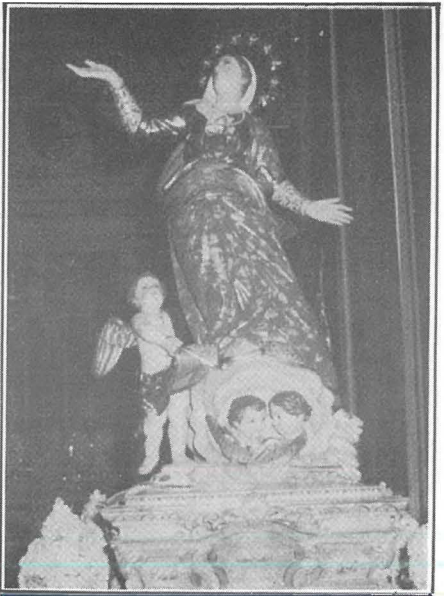
L-Istatwa tal-Madonna meqjuma fil-Parroċċa ta' l-Imqabba.

jew ta' Għadir il-Bordi kif ukoll żewġ knejjes oħra li darba kellhom din l-istess dedika; illum huma ta' San Pietru u tal-Belliegha b'titlu tat-Twelid tal-Madonna; knisja oħra fil-istess parroċċa dedikata lill-Assunta hi ta' Marin id-Dona. F'Hal-Luqa hemm il-Knisja żghira tal-ftajjar, fil-waqt li kemm l-Imġarr kif ukoll il-Mosta il-parroċċa hi dedikata lil Santa Marija. Fil-limiti tal-Mosta, fit-triq lejn l-Imdina, imbagħad hemm il-kappella ta' Żejfi, fil-waqt li knisja oħra f'dan ir-rahal, dik ta' dhib, illum tal-Viżitazzjoni, darba kienet tal-Assunta. Fl-Imqabba il-festa tal-parroċċa hi Santa Marija; f'dan ir-rahal ukoll hemm knisja, dik tad-Duluri, li darba kienet ta' l-Assunta. Fil-limiti tan-Naxxar, dik ta' Hal Misilmet jew tax-Xagħra, li illum nafuha b'tal-Grazzi, darba kienet dedikata lill-Assunta; tant hu hekk li l-festa għadha ssir sal-lum fil-15 t'Awissu. Fil-limiti ta' l-istess raħal hemm ukoll dik tal-Mghatab. Fil-limiti ta' Hal Qormi nsibu dik tal-blat jew tal-wied, dik ta' Qrejqċa, il-famuża knisja ta' Ħlas, kif ukoll dik tas-Samra jew ta' Atoċja, illum parti mill-Hamrun. Mill-knejjes ta' Santa Marija li ntemmu f'Hal Qormi kien hemm