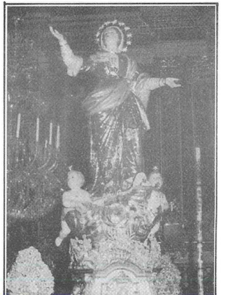
L-Istatwa tal-Madonna meqjuma fil-Parroċċa tal-Qrendi.