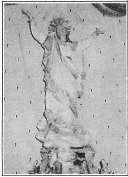
L-Istatwa tal-Madonna meqjuma fil-Knisja Kattorali ta' Ghawdex.