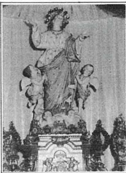
L-Istatwa tal-Madonna meqjuma fil-Parroċċa ta' Żebbuġ, Ghawdex.