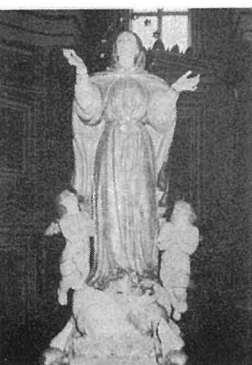
L-Istatwa tal-Madonna meqjuma fil-Parroċċa tal-Mosta.