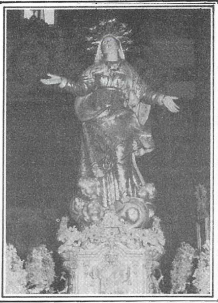
L-Istatwa tal-Madonna meqjuma fil-Parroċċa tal-Gudja.