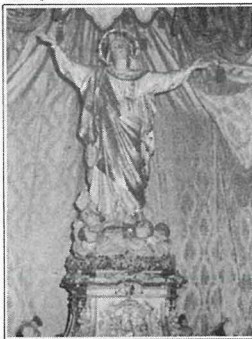
L-Istatwa tal-Madonna meqjuma fil-Parroċċa ta' M'Attard.