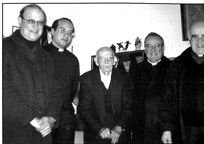
L-Arċisqof Mons. Pawlu Cremona jżur lil Dun Ġwann fit-3 ta' Awwissu 2007

Ftit huma dawk li jsemmu fil-pubbliku, però bosta huma dawk li Dun Ġwann kien għen tul hajtu. Biżżejjed insemmu s-sigħat twal ta' qrar li kien jagħmel fl-iskejjel tar-Rabat u Had-Dingli; fil-knisja tagħna u