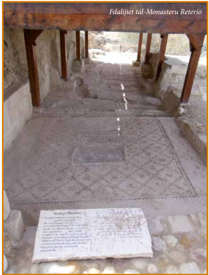
Fdalijiet tal-Monasteru Reterio

(tmiem is-seklju 5) kien bena knisja f'dan il-post, li kienet