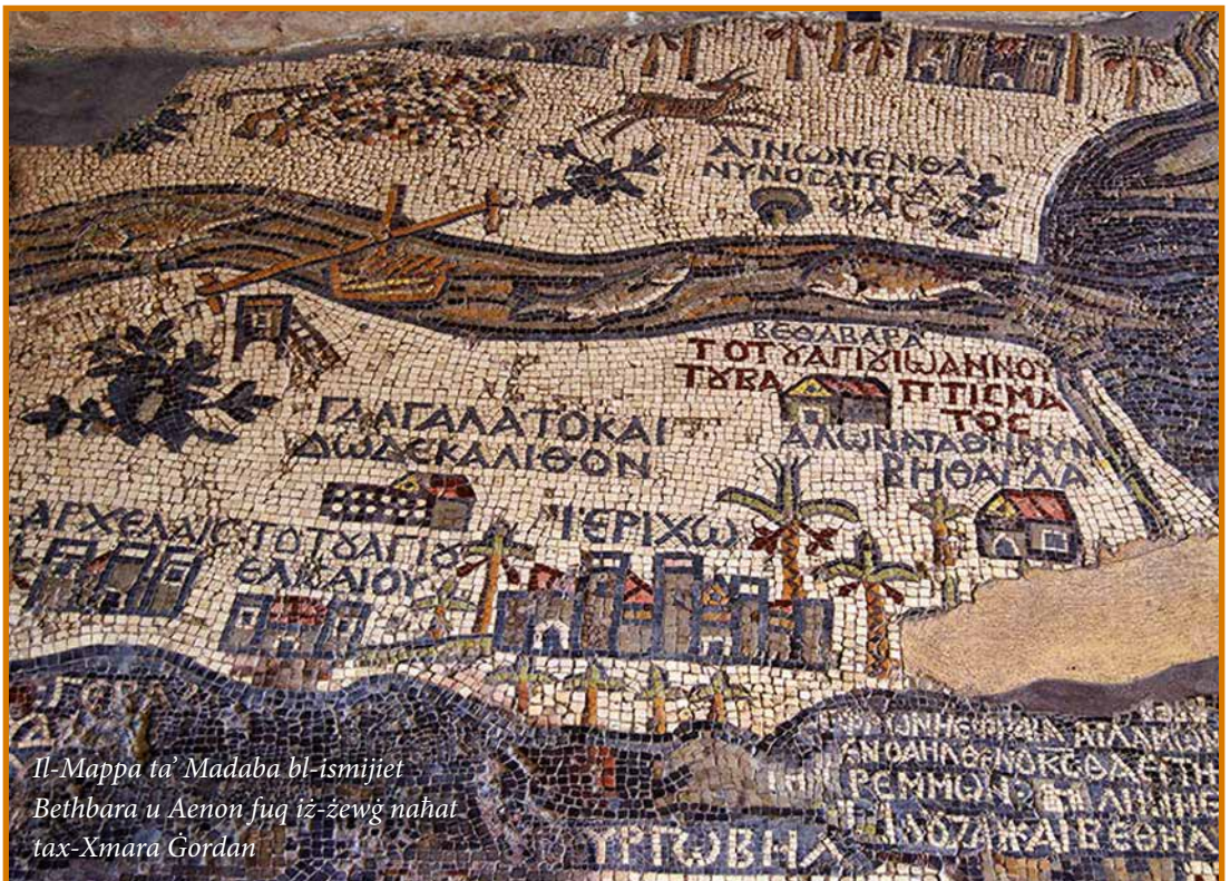
Il-Mappa ta' Madaba bl-ismijiet Bethbara u Aenon fuq iż-żewġ naħat tax-Xmara Ġordan

Ix-xhieda tal-pellegrini dwar il-Magħmudija tibda mis-seklu 4 u tibqa' għaddeġja sal-bidu tal-era Kruċjata. Bil-holqien tar-Renju Latin ta' Ġerusalemm, ix-xmara Ġordan kienet saret il-fruntiera tal-lvant