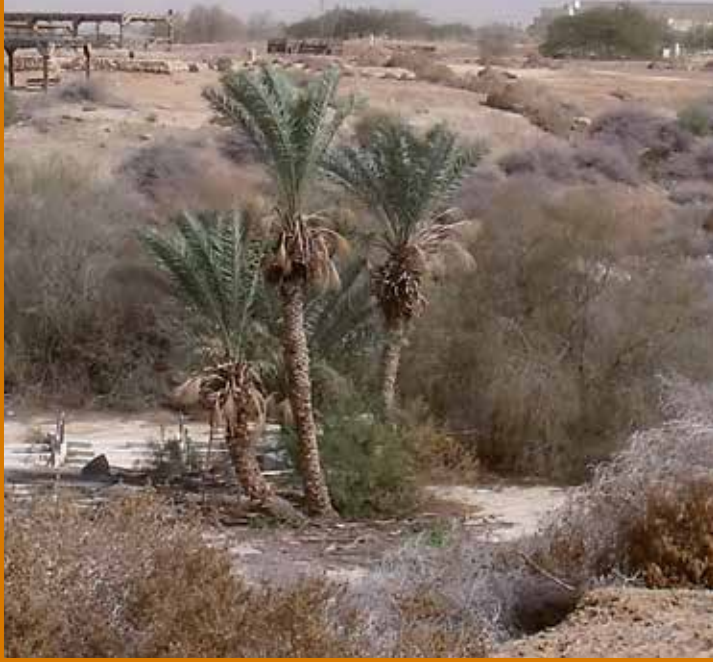
Wadi al Kharrar, il-Post tal-Magħmudija ta' Ġesù

hu kien għex go dak l-għar u kien irċieva diversi żjarat minn Ġesù hemmhekk. Mistieden biex jibqa' jgħix f'dak il-post, ir-raheb biddel l-għar fi knisja. Wara ftit taż-żmien ingabret hemmhekk komunità monastika. Mosco ifakkar l-isem tal-post, Sapsa (Sapsaphas fil-Mappa ta' Madaba) u jqiegħdu mhux ħafna bogħod mill-Wied ta' Kerit, fejn Elija kien għex matul il-perjodu ta' nixfa. Ftit wara, Mosco jirreferi għal storja dwar San Saba li għandha bħala protagonist tagħha lill-qassis Conone, li kien responsabbli mill-magħmudijiet fil-monasteru ta' Pentucla. Ftit nafu