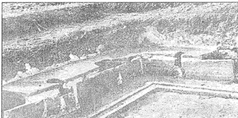
Dawn huma l-fdalijiet tal-kamra li ir-Rumani kienu jsejfulha 'latrinae'