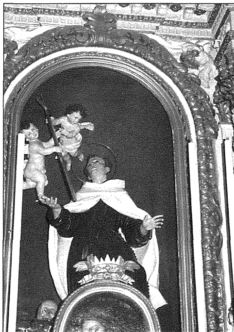
L-Istatwa ta' San Ġwann tas-Salib

Fit-22 fl-ewwel jum tat-tridu filgħodu fis-sitta tqaddset quddiea letta bil-prietka u bi tqarbina ġenerali, fid-disa' terza kantata u quddiea solenni bil-mużika mmexxija mill-Vigarju Ġenerali ta' dak iż-żmien Mons Ġuzeppi Mercieca. Fit-tlieta ta' wara nofsinhar sar panigierku bil-malti minn Patri Lawrenz Caruana OP, Pirjol tal-Kunvent tad-Dumnikani tar-Rabat. Wara tkanta l-ghasar bil-mużika u Barka Sacramentali.