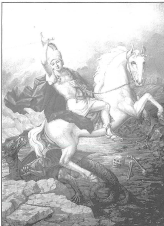
Pittura li turi lil San Ġorġ li riekeb fuq żiemel jissielet mad-dragun. Din il-pittura qieghda fis-sala ewlenija tal-każin tal-Banda San Ġorġ ta' Bormla.

Forsi jiehu hsieb l-Kunsill Lokali? Qabel nagħtu lista shiha ta' dawn l-istatwi u niċċeż li għandna ġewwa l-Belt Cospicua ta' min ifakkar li dawn huwa l-wirt Belt Twelidna u patrimonju li hallewlna missirijietna, dmirna huwa li niehdu hsiebhom, napprezzawhom u nibzghu għalihom biex ngħaddu dan il-wirt lil uliedna.