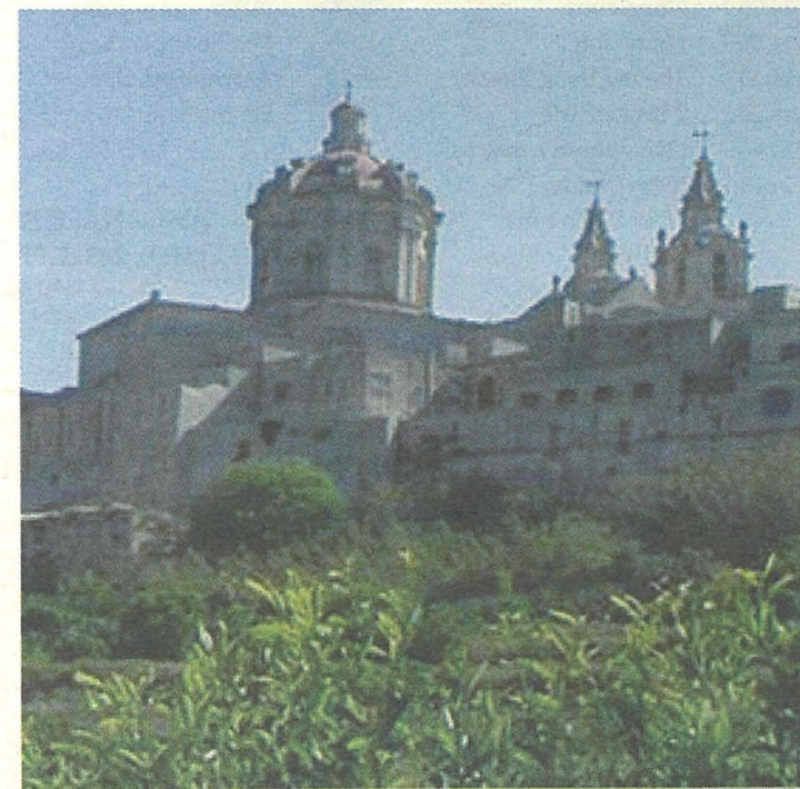
Dehra tas-Swar tal-Imdina