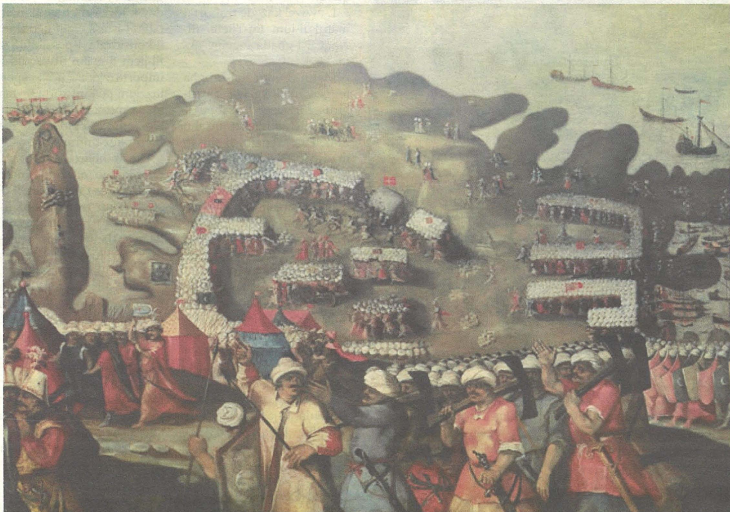
Il-wasla tal-Flotta Torka f'Malta

Bħalma jaf kulhadd, l-Imdina hi l-eqdem belt f'Malta. Għalkemm hadd ma jaf eżatt min bniha, xi storiċi jsostnu li din il-belt taf il-bidu tagħha lill-Griegi u l-ewwel isem tagħha kien Melith – kelma Griega u mhix Feniċja bħalma jaħsbu xi wħud.