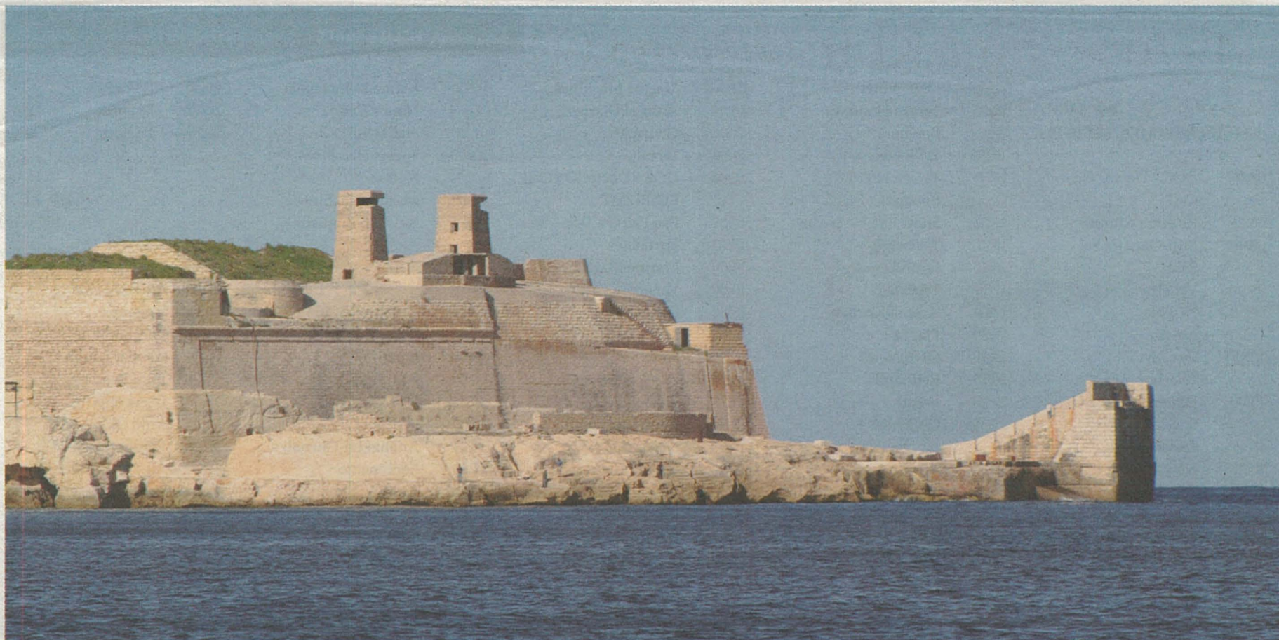
Il-Forti Sant'Iermu, fortizza li l-Maltin flimkien mal-Kavallieri ddefendew bi qlubija mit-theddida tat-Torok waqt l-Assedju l-Kbir