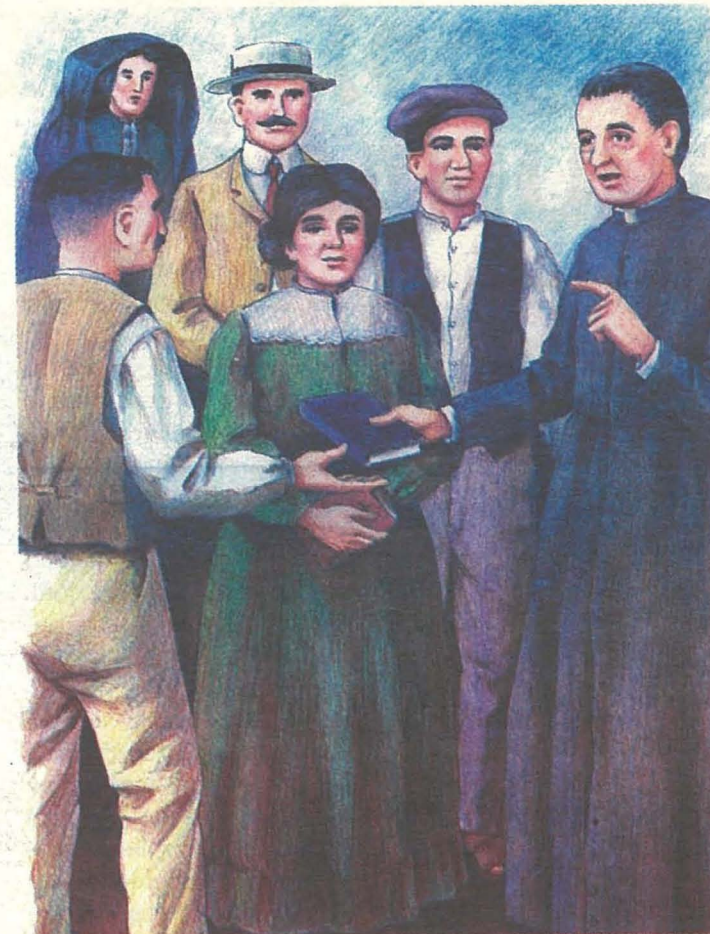
Hafna mill-Kappillani kienu kontra il-socji tal-Museum jtgħallmu u jgħallmu t-teologija, xi haġa li kellha tkun inkoraġġita sittin sena wara fil-Koncilju Vatikan II