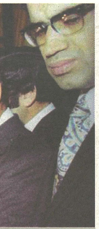
Mamo jagħmel l-ewwel diskors tiegħu bhala President ta' Malta

Kien fil-legislatura ta' bejn l-1971 u l-1976 li bdew taħdidiet bejn il-partiti politiċi biex tinbidel il-kostituzzjoni tal-Indipendenza b'wieħed mill-għanijiet ewlenija jkun li Malta minn monarkija ssir repubblika. Biex isiru l-emendi kostituzzjonali proposti, kienet tenhtieg magġoranza ta' zewġ terzi, u mhux kull deputat parlamentari kien jaqbel li minn monarkija Malta ssir Repubblika fosthom George Borg Olivier. Waqt it-trattattivi bejn il-partiti politiċi, Sir Antho-