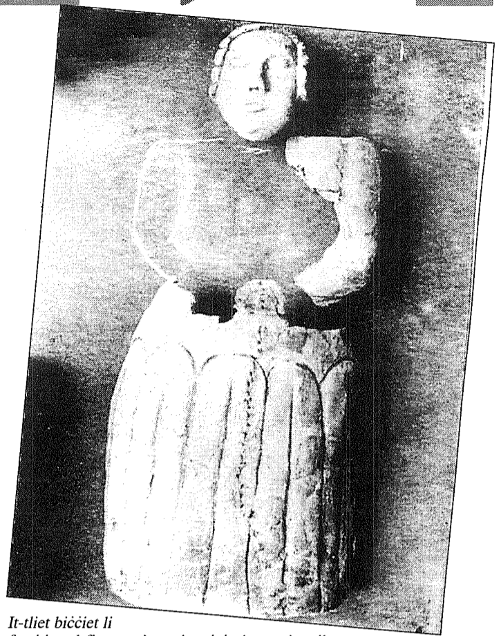
It-tliet biċċiet li forsi juru l-figura ta' qassis taż-żmien preistoriku

Waqt l-iskavi fit-tempji ta' Hal Tarxien kienu nstabu biċċiet ta' fuħħar li wara li kien sar l-istudju fuqhom kienu ndunaw li dawn kienu jagħmlu parti minn statwa. Sfortunatament dawn l-istess biċċiet kienu nqas