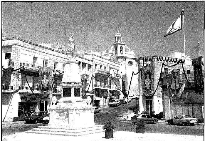
Il-Monument taċ-Ċentinarju mill-Inkurunazzjoni fi Pjazza Gavino Gulia.