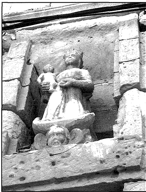
Il-Madonna bil-Bambin. Niċċa antika fi Triq Xandru.

Minbarra x-xbieha tal-Madonna tar-Raġġi fi Triq Xandru, insibu ohra mdaqqa fi Triq Luigi Rosato qabel taqbad Triq San Mikiel. Hija statwa miżbugha bajda fuq sfond ikhal u tinsab fuq xkaffa f'kantuniera. Ikollha fjuri u xemghat quddiemha u ma' ġenbha hemm