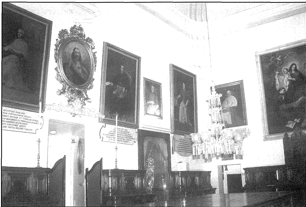
Is-sagristija fejn hemm l-iskrizzjonijiet ta' l-inkvadri.