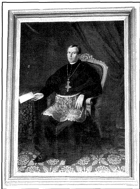
Gaetano Pace Forno

INDVLSIT, PRAESVLI VIRTUTE ET DOCTRINA CONSPICVO xvi GRATI ANIMI xvii [HOC] MONVM[ENTVM] POSVIMVS.