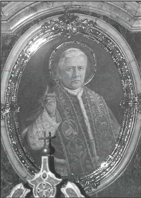
San Piju X

Bhal dan iż-żmien mitt sena, id-dinja Kattolika kienet qed tfakkar għeluq il-hamsin sena tad-Domma tal-Konċepiment Immakulat ta' Ommna Marija. Kulhadd għażel il-mod u l-waqt li jagħmel dan. Iżda l-ghan kien l-istess – dak li jinxtetet quddiem Marija b'turija ta' g'ieh għal dan il-privileġġ singulari li ghoġbu jsawwab fuqha dak li jista' kollox.