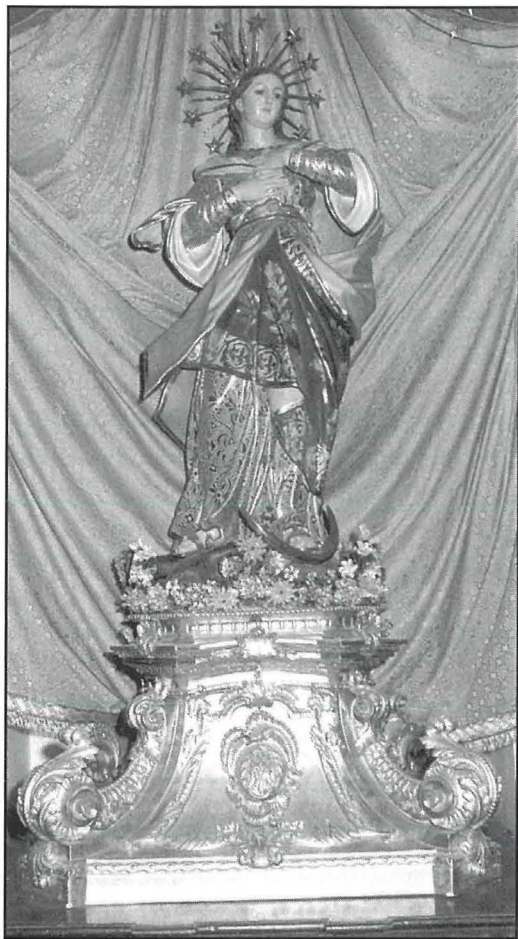
Il-Kunċizzjoni fil-knisja ta' San Franġisk, Ghawdex li nħadmet fl-injam mill-iskultur Bormliż Salvu Psaila fl-1848.

Wara nofsinhar wara l-Ghasar u l-Kompieta, kien isir diskors fuq il-Madonna. Ma' tmiemu titkanta l-Antifona, is-Salve Regina, il-Litanija u wara tinghata l-Barka Sagramentali. Id-diskorsi tat-Tridu saru mill-Ġiżwita Scio, il-Konventwal Tonna Barthet u l-Karmelitan Atanasio Cuschieri.