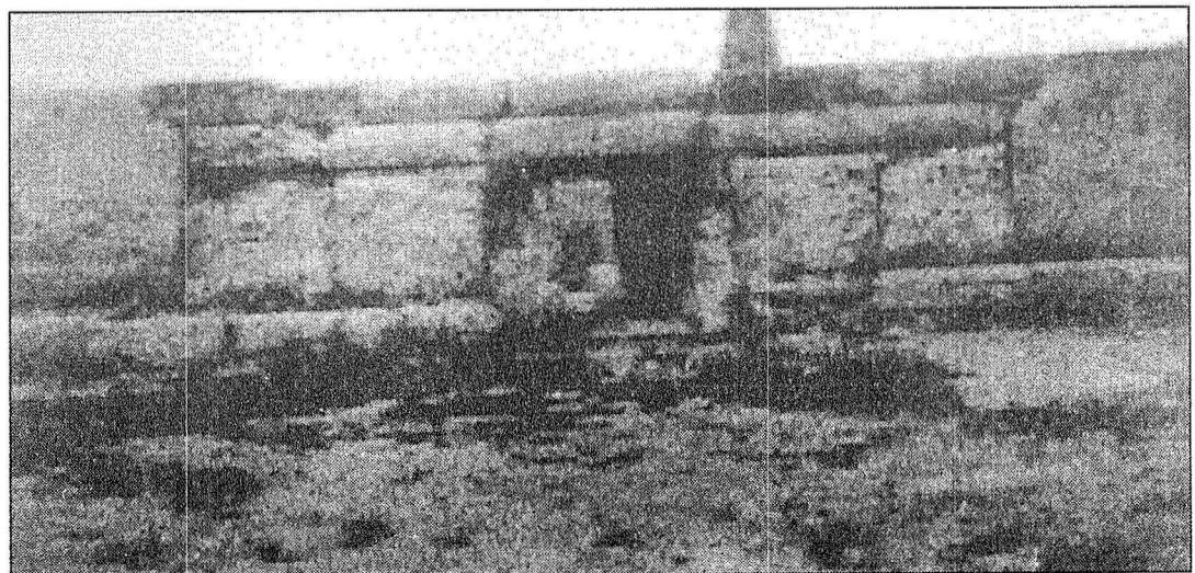
Il-faċċata ta' Haġar Qim

Dawn huma biss dettalji li naraw fil-bidu ta' dawn il-fdalijiet. F'appuntamenti oħra nkomplu nagħtu aktar informazzjoni dwar it-tempji ta' Haġar Qim.