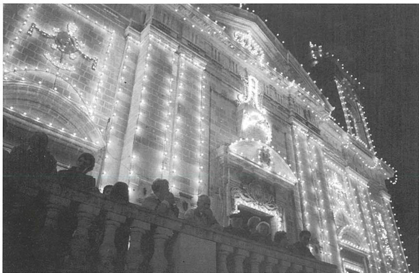
Il-faċċata tal-Knisja Parrokkjali u Kolleġġjata ta' Bormla.

Aktarx li l-ewwel taghrif uffiċjali dwar il-parroċċa ta' Bormla nsibuh fil-Vista Appostolika li kien ghamel f'Malta l-Inkwizitur Mons. Pietro Dusina fl-1575. Mons. Dusina mar Bormla fid-19 ta' Frar, 1575. Dakinhar żar il-knisja ta' Santa Marija tas-Sokkors li fiha sa minn qabel l-Assedju l-Kbir (1565) kienu jamministraw xi sagramenti. Imma ġara li fl-Assedju l-Kbir l-abitanti ta' Bormla trekknu fil-Birgu. Fir-rapport tiegħu, fost l-ohrajn, Mons. Dusina jghid li din il-Knisja ma kellhiex rettur imma kienu jiehdu hsiebha tliet prokuraturi lajċi, jghid li kienet mibnija tajjeb u li kienet miżmuma sewwa. Kellha altar maġġur u altari ohrajn, aktarx tnejn. Ma kellha ebda piżijiet u dhul, iżda fiha kien jinżamm is-Sagrament.