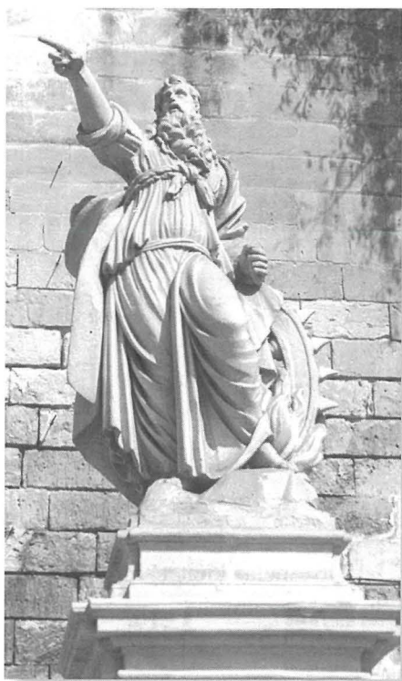
L-istatwa tal-ġebel ta' Sant'Elja, li helsitha mill-qilla tal-gwerra

Vinċenz de Paula, is-Solidalià tal-Qassisin u kongregazzjonijiet oħra, li llum hafna minnhom spiċċaw.