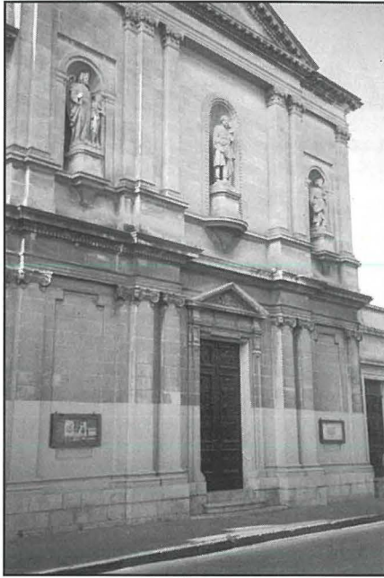
Il-kappella ta' San Ġużepp li tinsab f'Santa Venera.

F'Santa Venera l-knisja għandha daqs daqsxejn kbir meta tqabbilha ma' dawk li diġà semmejt. Din il-knisja bnietha Dun Ġorġ Bugeja fl-1906 u magħha bena wkoll istitut li kien jintuża biex fih jilqa' dawk it-tfal li kienu jiġġerrew fit-toroq. Il-flus biex tinbena din il-knisja kienu nġabru u nġataw minn Dun Ġorġ stess bl-ghajjnuna ta' xi benefatturi. Infatti benefattur li għen hafna biex tinbena din il-knisja kien Karmenu Bugeja li kien qarib ta' Dun Ġorġ. Meta wiehed jidhol go din il-knisja jinduna bil-kor, żewġ kappelluni u kursija. Għandha tliet altari u fiha għamla ta' salib latin. Fil-ġenb għandha kampnar. Nhar l-14 ta' Mejju 1916 Mons. Mawru Caruana l-isqof ta' Malta kkonsagra din il-knisja u fl-altar maġġur qiegħed ir-relikwi tal-qaddisin Ġuswar, Beninju u Vittorju. Go din il-knisja wiehed jista' jammira żewġ kwadri xogħol iż-Żebbuġi Lazzaro Pisani li juru tar-Rużarju (1919) u lil Kristu fl-Ort (1920).