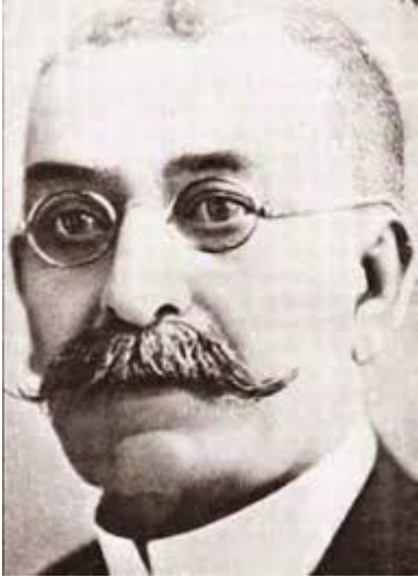
Ġuzè Muscat Azzopardi

Wiehded mill-ewlenin rumanzieri li kitbu rumanzi bil-Malti kien Ġuzè Muscat Azzopardi. Twieled fl-1 ta' Settembru 1853, u miet fl-4 t'Awwissu 1927. Dan ma kienx biss awtur u rumanzier, iżda wkoll poeta u politiku, u bħala professjoni kien Prokuratur Legali. Jidher li huwa studja l-istorja ta' Malta biex fiha jkun jista' jambjenta r-rumanzi tiegħu, li allura kienu