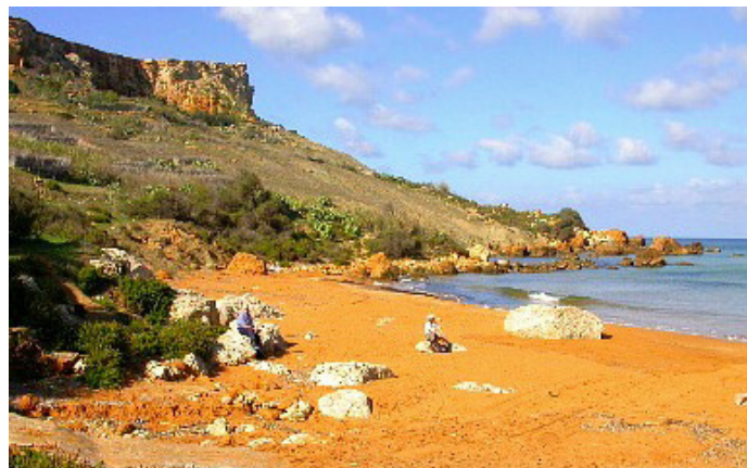
Ix-xtajta ta' San Blas - 'bint is-sbuħija'

U n-Nadur kburi b’dik il-koppla twila iħares fuq San Blas, ħabiba ta’ ġewwa,