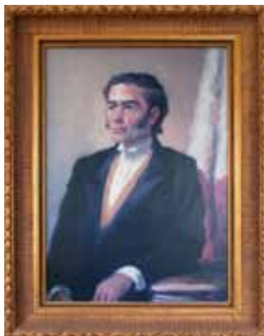
Mikiel Anton Vassalli meqjus bħala Missier l-ilsien Malti