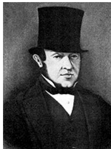
Ġan Anton Vassallo