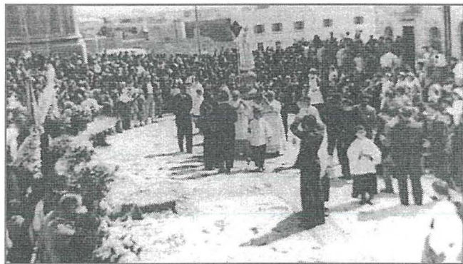
Il-Pellegrinaġġ bl-istatwa tal-Madonna ta' Fatima li sar fit-2 ta' Mejju 1948 f'Birzebbuga. Dakinhar saret quddies maġenb il-knisja n-naħa tal-kampnar. Ma kinitx l-istess statwa li għandna illum fil-Parroċċa. Dik saret wara.

Mis-sena 2000 'il hawn, il-pellegrinaġġ beda jitlaq minn fejn iċ-Ċentru tal-Freepport u wara li jintemm kollox, inkluz il-quddies tal-Kappella ta' Bengħisa, issir attivitā soċjali. Sadattant, bdiet issir attivitā simili għat-tfal, li għaliha tintuża l-istatwa l-oħra tal-Madonna ta' Lourdes, minħabba li din tal-aħħar hija eħfef mill-oħra. Dawn il-pellegrinaġġi, jgħaddu minn trejqa dejqa qalb l-għelieqi u l-iriziet. F'post partikulari, kien ikun hemm siġra li l-friegħi tagħha qabzu