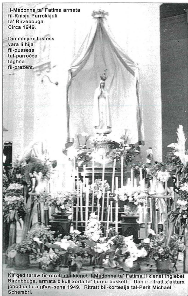
Il-Madonna ta' Fatima armata fil-Knisja Parrokkjali ta' Birzebbuġa. Circa 1949.

Ha mmorru issa lura fiż-żmien u nagħtu issa ħarsa lejn il-programm ta' kif kienu jiċċelebraw il-festi f'dawk iż-żminijiet. Illum imdorrijin bil-konċelebrazzjonijiet fil-quddies ta' filgħaxija iżda dak iż-żmien il-quddies kien isir filgħodu biss u jquddes saċerdot