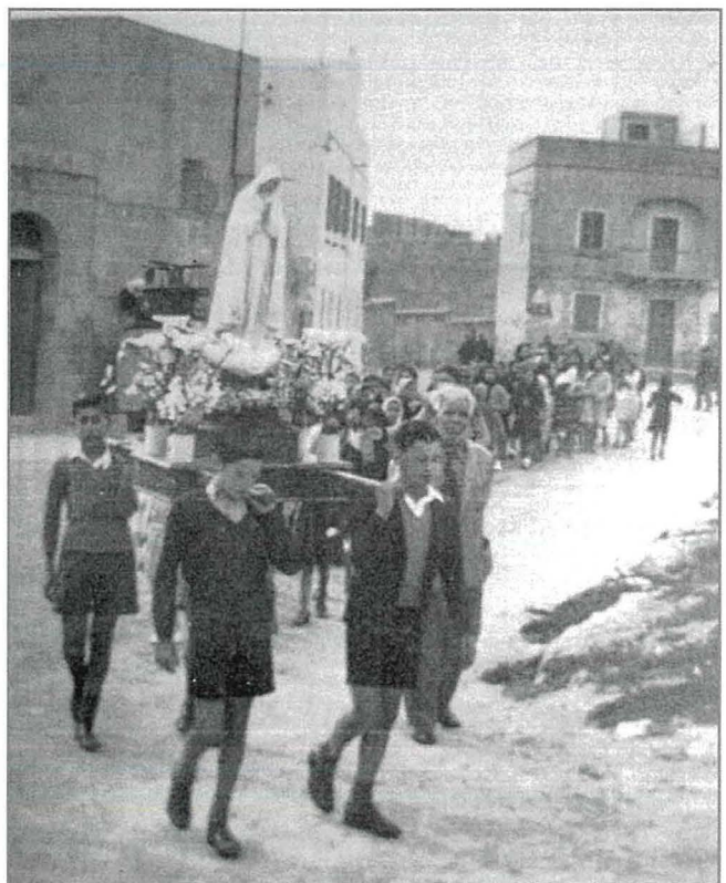
Dan ir-ritratt tidher il-purċissjoni bil-Madonna ta' Fatima riesqa lejn il-Knisja Parokkjali. X'aktarx li din il-purċissjoni kienet organizzata mill-membri tal-M.U.S.E.U.M. Fl-isfond fil-kantuniera jidher il-hanut tal-inbid li kien ta' čerta waħda magħrufa bħala Ġanna n-Naqqa.