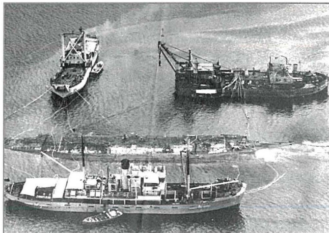
HMS Breconshire qed jittella' mill-qiegh tal-baħar fil-Port ta' Marsaxlokk viċin ħafna ta' Birzebbuga.

L-aħħar vjaġġ li għamel il-Breconshire bejn Malta u l-Eġittu u viċi-versa, li kienet ir-rotta prinċipali li kien jopera fuqha sabieħ ikun jista' jgħid il-merkanzija ġenerali fuqu kien il-vjaġġ ta' Marzu tal-1942 minn Lixandra. Wara li wassal lill-internati lejn l-eżilju, kien