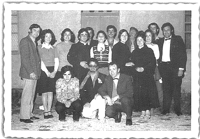
Membri tal-Entertainments Board li fis-snin 1970ijiet kien twaqqaf fi hdan il-Banda Mnarja, flimkien ma' numru ta' atturi waqt wahda mill-produzzjonijiet li kienet saret f'dawn iż-żminijiet.

L-iktar grajja importanti li ġrat matul is-sena 1978 kienet bla dubju l-ftuħ ta-Teatru Odeon għall-wiri tal-films. Odeon huwa l-isem li kien inġhata lis-sala li kienet inbniet fuq il-każin kollu. Il-Kumitat dam hafna