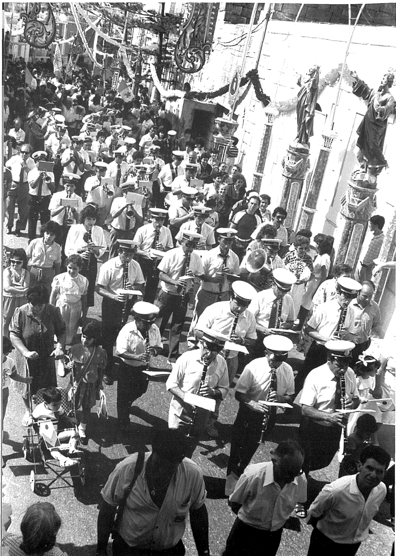
Il-Banda Mnarja fi Triq San Ġwann fil-festi Triċentinarji tas-sena 1988.