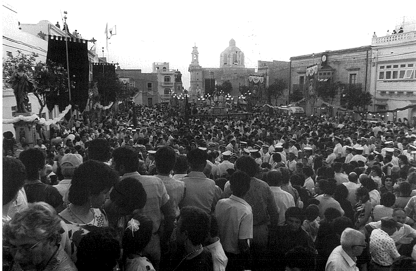
Il-folla qabel il-ħruġ tal-Purċissjoni Pontifikali fil-festi Tricentinarji tas-sena 1988.