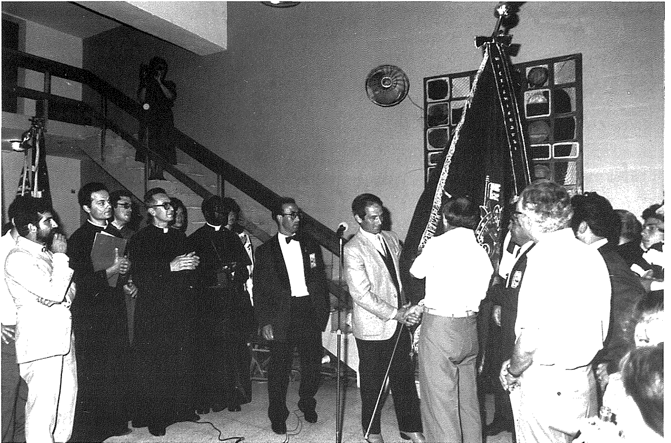
Mumentu miċ-ċerimonja tal-ghotja tal-istandard lill-Banda Mnarja mill-'Australian – Nadur Association' fil-jiem tal-festi Triċentinarji tas-sena 1988.