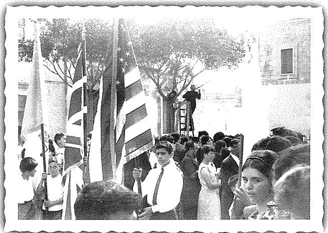
L-istandardi nhar jum l-inawgurazzjoni tal-Banda Mnarja fis-16 ta' Ġunju 1968.

Rigward l-uniformi tal-bandisti, il-Kumitat iddecieda li għandha tkun hekk: Qmis bajda, qalziet iswed u ingravata fuq l-aħmar. Wara għażla kbira ntgħażlet waħda hamra bil-faxxi rqaq bojod. Il-beritta kellha tkun b'faxxa hamra b'zewġ zigarelli