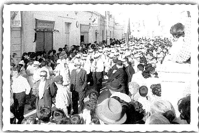
Il-Banda Mnarja nhar jum l-inawgurazzjoni tagħha fi Triq il-Kbira, illum Triq Diċembru 13.

bottegin spazjuż kif tidhol mit-triq, wara sala li kellha sservi għall-provi tal-Banda, dances, parties, eċċ., xi kmamar fuq wara u bitha. Għal fuq imbagħad, giet ipprogettata sala kbira fuq kollox.