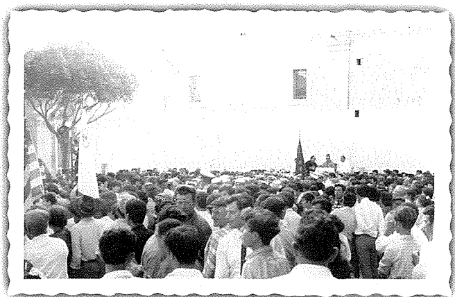
Parti mill-folla miġbura fil-Pjazza nhar jum l-inawgurazzjoni.

Mill-bogħod il-bogħod ingbarna, Nies qlubija Nadurin Għal dawn il-Festi Ċentinarji Ma' twemminna marbutin.