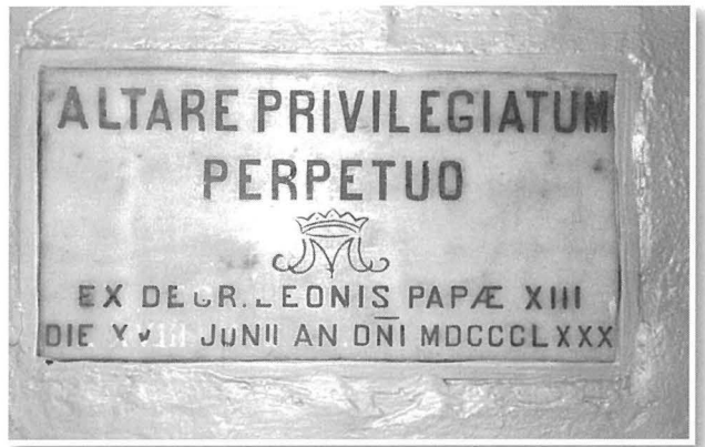
L-irhama li tfakkax il-privileġġ li jgawdi l-Artal ta' San Ġuzepp u li tinsab biswitu.

F'din il-parti wkoll insibu min kellu dritt ikun preżenti għall-konsulta privata u kull meta din setgħet tiltaqa' u kif. Setgħu jattendu għaliha biss il-membri tal-kumitat u kellha tiġi msejja mill-prefett wara li jkun informa lill-Kappillan. Il-prefett seta' jsejjah konsulta privata meta jidhirlu li huwa neċessarju, u