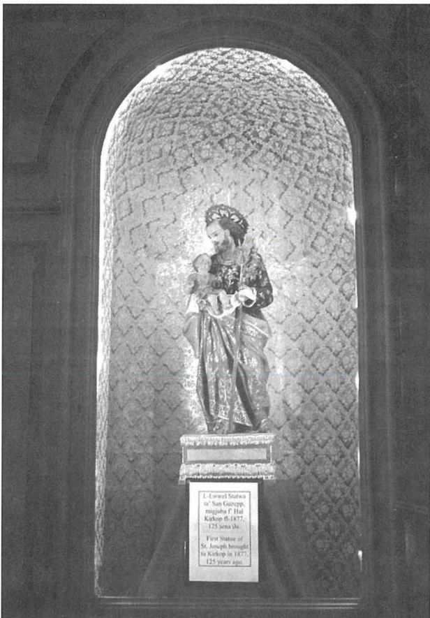
L-Ewwel Statwa ta' San Ġużepp fi żmien il-Kappillan Barbara, li illum tinsab fil-Kappella tal-Loretu tal-Gudja.

Wara dan il-vers, li nistgħu nġhidu li miegħu jdur ir-rikors kollu, insibu nota li tghid li hemm ukoll inklużi l-istatut u r-regolamenti ta' din il-Fratellanza l-ġdida li kellha titwaqqaf, sabiex dawn jiġu eżaminati u approvati mill-Isqof. Ir-rikorrent jinsisti li dawn saru biex din titmexxa sewwa u li kollha jwasslu għal kult aqwa lejn il-Qaddis.