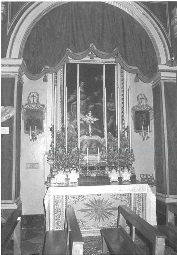
L-Artal ta' San Ġużepp armat għall-Festa.

Hawn ir-rikors jaghti xi dettalji dwar x'kienu s-suffraġji għall-erwieh. Meta jmut membru tal-Fratellanza (raġel jew mara), il-membri l-oħra kellhom isumu darba għalih sa sebat ijiem wara mewtu u kellhom ukoll joffru hames posti tar-Rużarju għall-