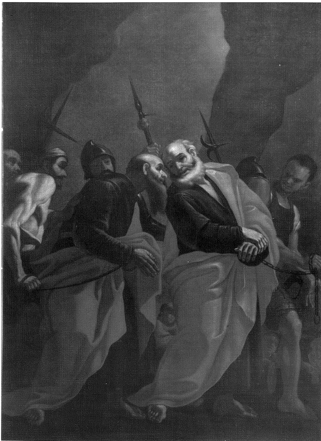
L-Ahhar Tislina tal-Appostli San Pietru u San Pawl Kwadru Titulari Kolleggjata Insinji u Bazilika tan-Nadur

Skola tal-Preti tal-bidu tas-Seklu Tmintax.