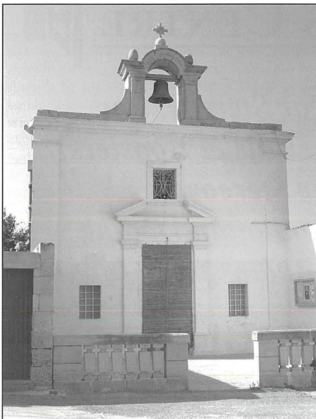
Il-Kappella tal-Kunċizzjoni f' Benghisa

Il-Missjoni l-Kbira kienet tkun iffurmata minn numru ta' saċerdoti li kienu jkunu fost l-aqwa predikaturi li kont issib fi gżiritna f'dak iż-żmien. Li kien jiġri kien li dawn kienu jduru rahal rahal u flimkien kienu jqattghu madwar tliet ġimgħat iqaddsu u jippridkaw. Tul iż-żmien li kienu jqattghu f'xi rahal partikolari huma kienu jorqdu hemm ukoll. Dan kien jiġri għal żewġ raġunijiet. L-ewwel raġuni kienet tkun sabiex dawn ikunu iktar qrib il-fidili li kienu jghixu f'dak ir-rahil partikolari, u t-tieni minhabba t-trasport fqir li kien jeżisti f'dawk iż-żminijiet. Dawn is-saċerdoti kienu jqaddsu fil-knisja parrokkjali ta' dak ir-rahil jew belt li jkunu qed iżuru u wkoll f'xi kappelli oħra fil-kampanja sabiex b'hekk jiżguraw li jkunu laħqu lil kulhadd. Barra minn dan, huma kienu maghrufin l-aktar għall-priedki li ta' kuljum kienu jagħmlu tul il-ġranet li kienu jqattghu f'dak ir-rahil partikolari.