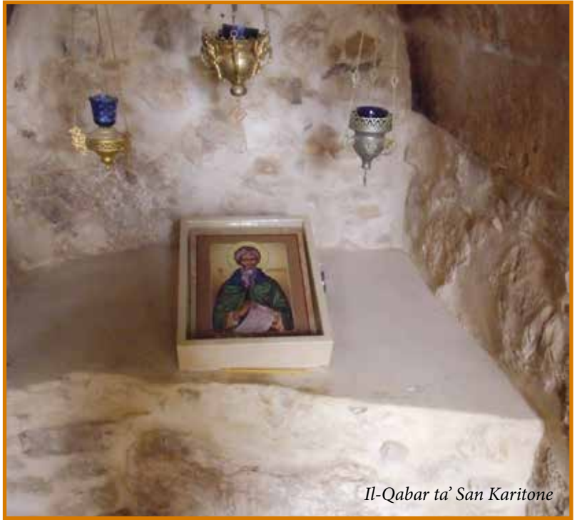
Il-Qabar ta' San Karitone

jgawdu l-frisk tal-ilmijiet li jnixxu fil-wied. L-għerien u l-fdalijiet ta' fortizzi kienu postijiet ideali biex fihom isibu kenn l-eremiti u l-monaċi tal-ewwel sekli tal-era Kristjana, fosthom l-aktar wieħed famuż li ta bidu għall-ħajja monastika fil-Palestina, San Karitone.