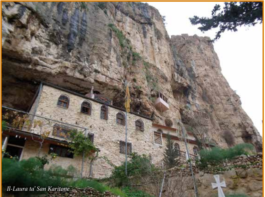
Il-Laura ta' San Karitone

Dan il-wied karatteristiku tad-deżert tal-Lhudija minn dejjem kien post ta’ rifuġju li fih insibu insedjamenti, monasteri u fortifikazzjonijiet li huma kollha xhieda li dan il-wied għammil f’nofs id-deżert kien abitat. Għad hemm fdalijiet ta’ mithna tad-dqiq li taħdem bl-ilma ħdejn il-monasteru ta’ Wadi Farah, li hu l-aktar binja importanti li fadal f’dan il-wied li llum hu Natural Reserve tal-iStat ta’ Israel, u zona popolari ħafna għall-familji li johorgu