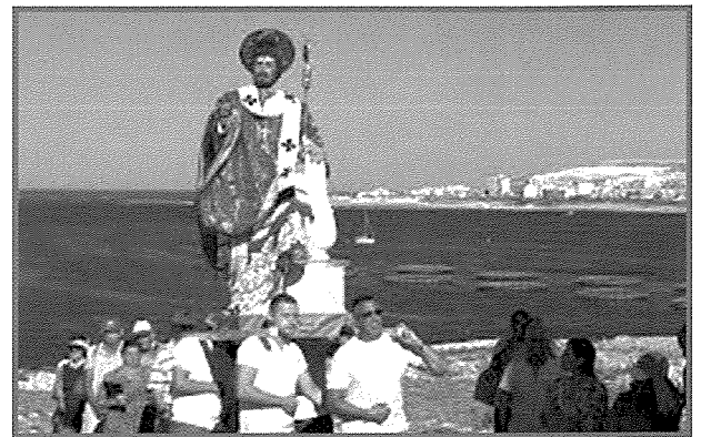
Statwa ta' San Publju fuq il-Gzejjer ta' San Pawl

Fl-Atti tal-Appostli nsibu, li dawk li ħelsu mill-għarqa ġew milqugħa minn Publju il-Ħakem tal-Gżira -Malta li politikament kienet tagħmel mal-Provincja ta' Sqallija. Il-Praetor ta' Sqallija kien irrappreżentat f'Malta minn Legat li kien jissejjah Melitensium Primus Omnium . Dan kien Publju, Malti, mogħni b'uffiċċju Ruman.