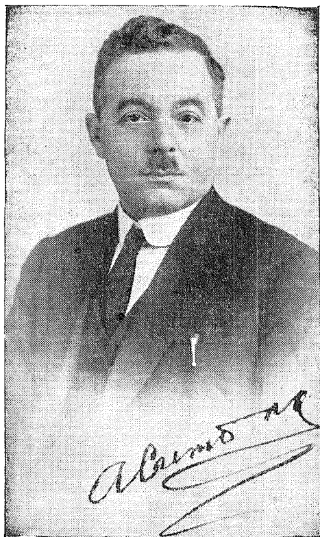
Is-Sur Nin Cremona fil-hegga letterarja ta' zghozitu.

cat Azzopardi, meta hu, mill-bidu ta' zghozitu bil-kitba tieghu kien ghame! hiltu kollha biex jerfgu u jaghtih il-gieh li kien jisthoqqlu bhala Lsien mitke'lem milli-Poplu b'inkejja tax-xkiel ahrax ta' dawk li dak iz-zmien kienu jismerruh. Izda ghalija, nitke'lem ghalija, ghax il-lum il-persuna tieghi bhala wiehed mill-kittieba xjuh tal-Malti, fil-laqgħa tal-lum, jidher li għandha xi