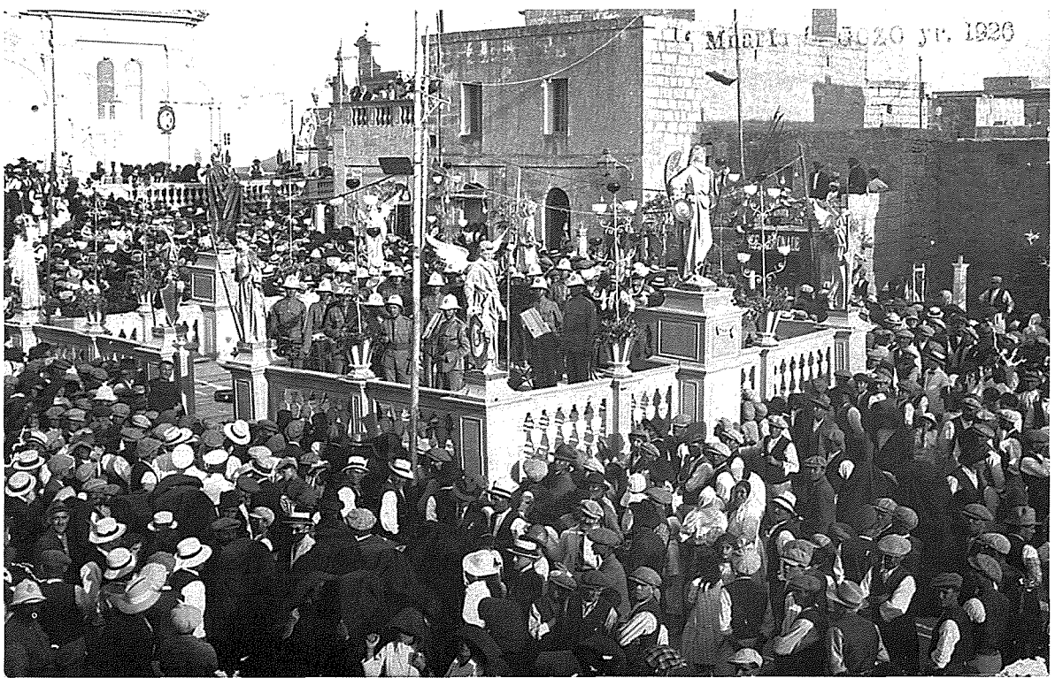
Il-Banda 'Sant Elena' ta' Birkirkara fuq il-palk tal-banda fil-festa tal-Imnarja fin-Nadur fis-sena 1926. Banda li bi tradizzjoni sa zminijietna ta' kull sena ghadha tkun mistiedna ghall-festa fin-Nadur.