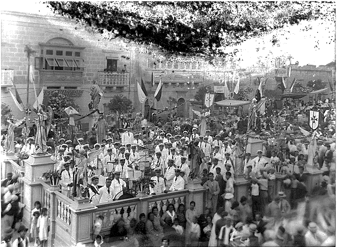
Il-Banda 'Filarmonika La Valette' tal-Belt Valletta. Memorja mill-isbah tas-sehem ta' din il-banda fil-festi f'għieh San Pietru u San Pawl fin-Nadur fis-sena 1938.