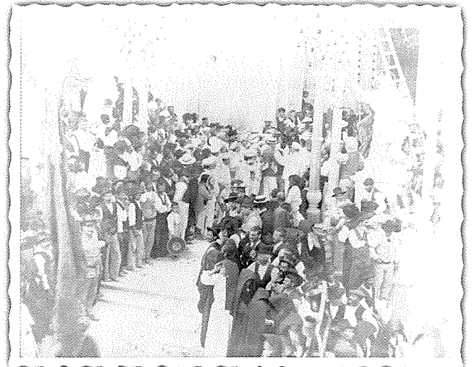
'L-Arkati' fuq iz-zuntier tal-Kollegġjata tan-Nadur armati bit-tazzi taż-żejt qabel ma' fis-sena 1926 daħal l-użu tad-dawl elettriku.

kienet laħqet £11. F'din is-sena tista' tgħid li l-illuminazzjoni fil-festa tal-Imnarja kienet magħmula mit-tliet generi ta' mixegħla differenti. Dawn kienu, dik bikrija bin-nar li għaliha kienet intefqet is-somma ta' qrib £20, dik bit-tazzi taż-żejt, u dik bid-dawl elettriku permezz ta' ġeneratur. iv