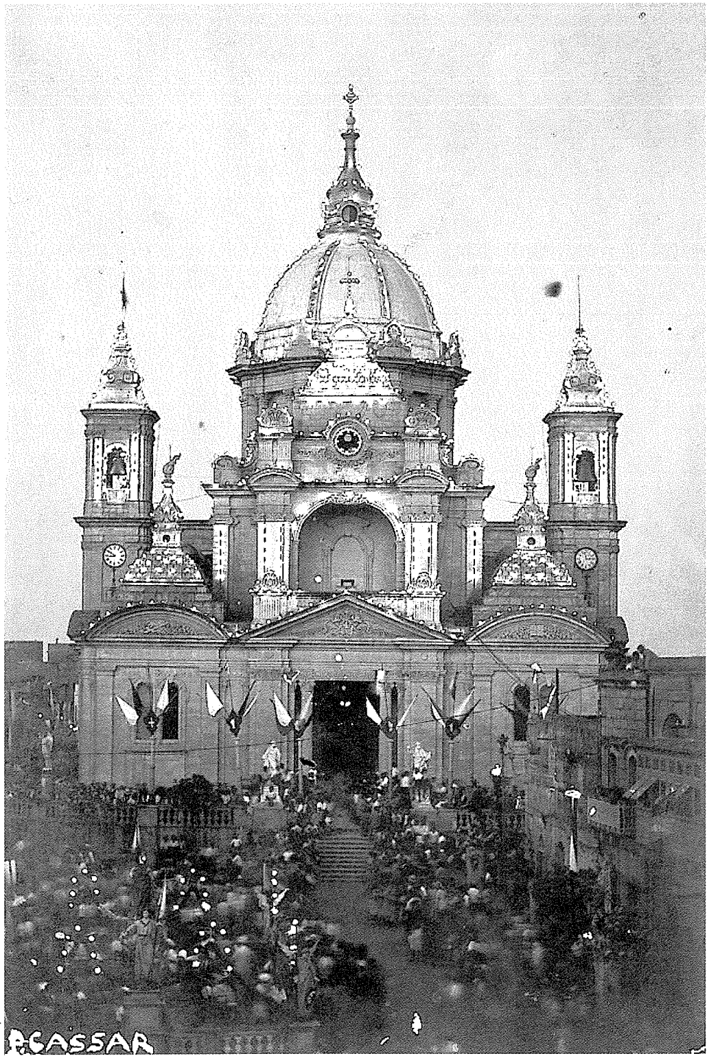
Seklu Ghoxxrin Ritratt antik tal-Kollegġjata tan-Nadur mixghula bil-lampi tad-dawl elettriku.