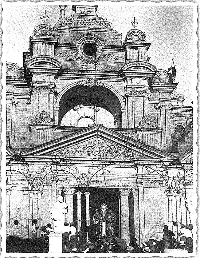
Il-faccata tal-Kollegġjata tan-Nadur armata fl-ewwel żmien bil-lampi tad-dawl elettriku minflok bit-tazzi taż-żejt. Ritratt meħud qrib is-sena 1930.