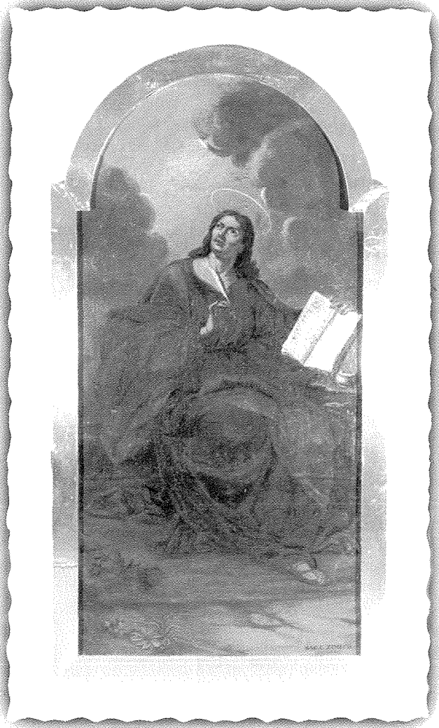
Awla Kapitulari Kollegġjata Insinji u Bażilika ta' San Pietru u San Pawl San Ġwann Evanjelista Xogħol fuq it-tila li sar minn Dun Karlu Żimech. ( c 1760 )

Kruċifru. L-ewwel Salib tal-Kleru, l-antik, il-parti ta' fuq biss huwa tal-fidda. Dan kien sar ċirka s-sena 1730. Kellu l-lastat tiegħu tal-injam li biż-żmien saret tar-ram argentat. F'din is-sena 1785 insibu li saret xi tiswija lil dan is-salib li kienet tiswa 2 skudi u 8 tarí (0.51c ta' euro).