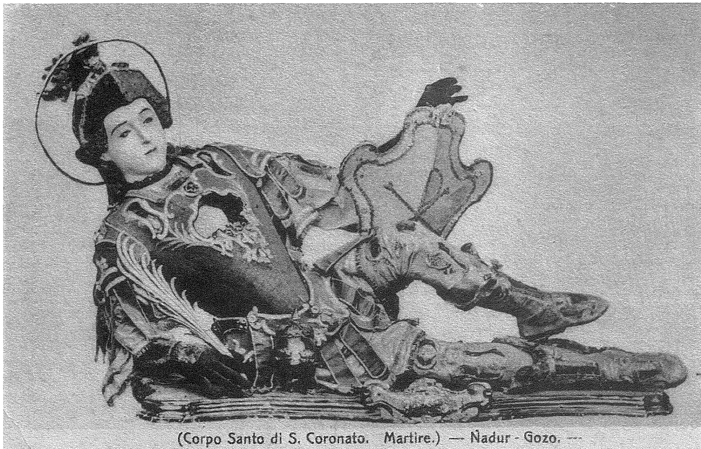
Il-Korp-Sant ta' San Koronatu Martri, qabel is-sena 1951.

martri u kiteb epigrammi fuq l-irham biex jitpoġġew fuqhom. Il-katakombi kienu sarullhom ukoll xi arrangamenti halli jkun hemm aktar aċċessibilità għan-numru ta' pellegrini li jżuruhom. 12 Mas-seklu hamsa iżda, l-użu ta' dawn il-katakombi nbidel u ma baqghux aktar postijiet tad-dfin għalkemm dejjem baqghu postijiet ta' qima u miżjura minn pellegrini mill-Ewropa kollha, 13 speċjalment meta fil-Medju Evu kiber il-kult lejn ir-relikwiji u saħansitra żviluppa negozju bihom. Il-Barbari li kienu ssakkegġjaw lil Ruma kienu wkoll ħarbtu partijiet minn dawn il-katakombi u Aistulf, re tal-Lombardi, fis-seklu tmienja dahal fihom u seraq minnhom hafna relikwiji. Il-Papat ma baqax aktar f'pożizzjoni li jista' jipproteġihom u Pawlu I (757-767) ha diversi fdalijiet u poġġiehom fil-knejjes. 14