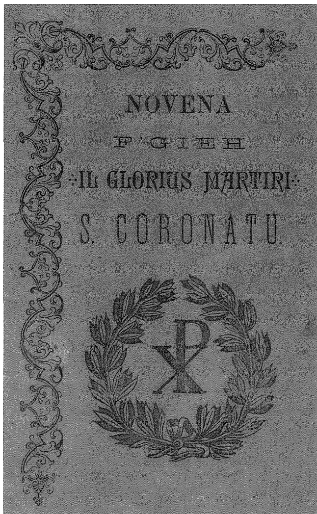
Il-qoxra tan-Novena ppubblikata fl-1900 li tagħha l-kopji li fadal tghoddhom fuq subgħajk.