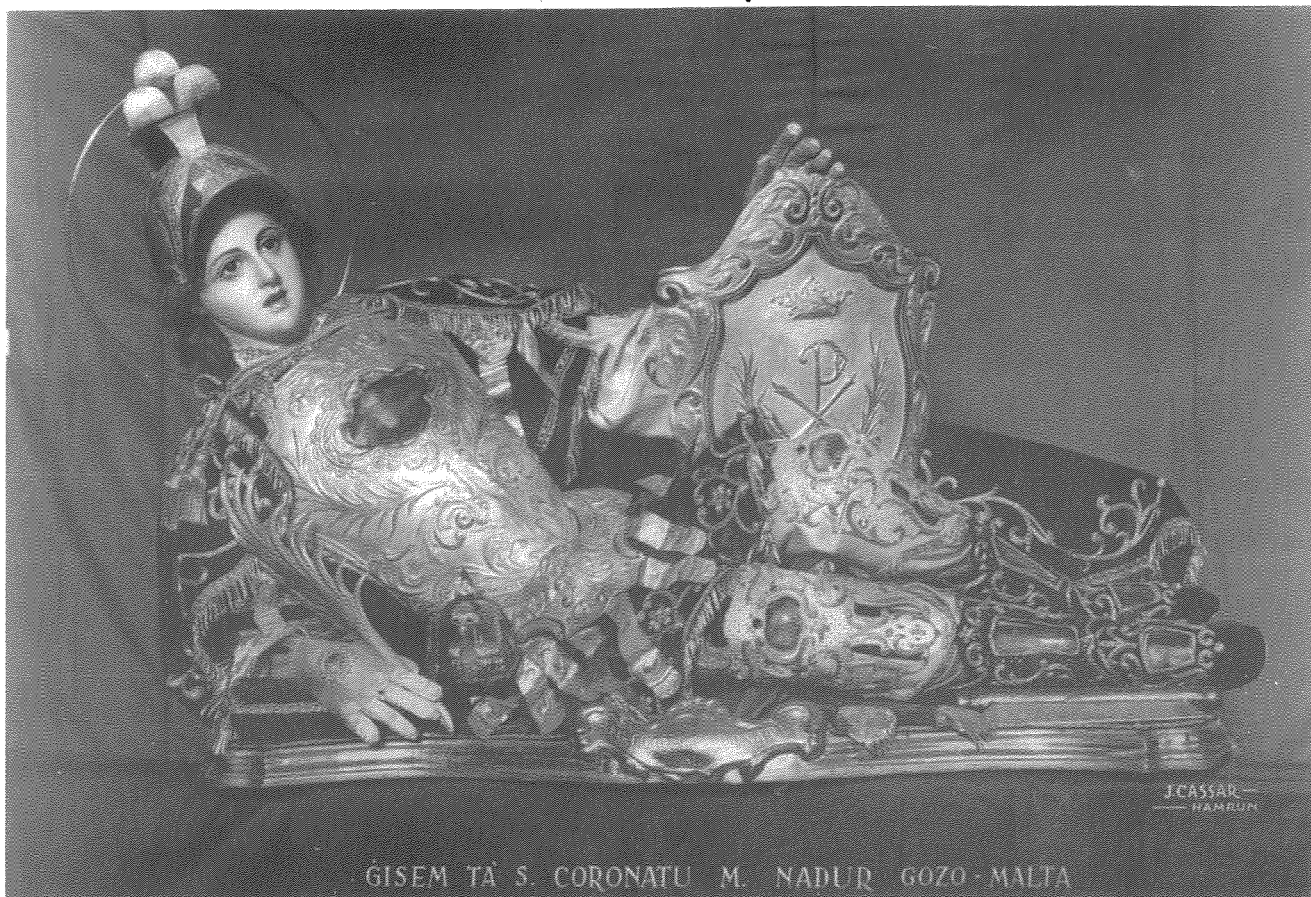
Il-Korp-Sant ta' San Koronatu Martri.