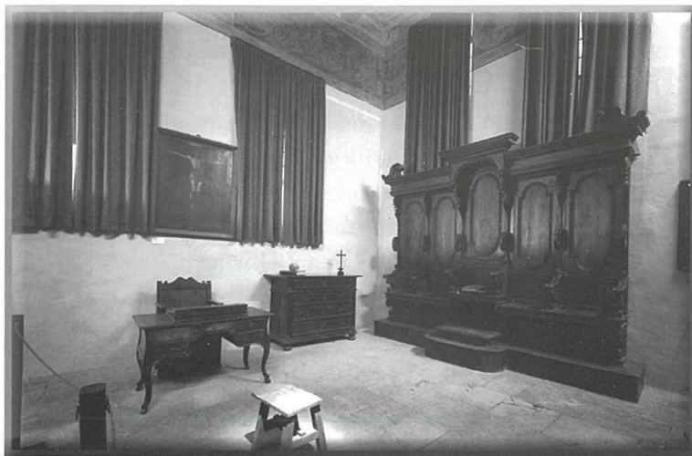
L-Awla tat-Tribunal tal-Inkwizizzjoni f'Malta

Li hu żgur huwa li skont it-twemmin nistrani, id-dagħa huwa meqjus bħala dnuv mejjet meta wieħed ikun konxju tal-kontenut tal-kliem li qal, jiġifieri meta jkun jaf li l-kliem li lissen huma dispett lejn Alla u s-Sagru. Studju fuq is-soċjoloġija tad-dagħa, A. Montagu jgħid li d-dagħa jista' jkun forma ta' reazzjoni kontra l-frustrazzjoni. F'dan is-sens, id-dagħa jista' jfisser sura ta' mgħiba kulturali kkundizzjonata li sservi żewġ skopijiet: l-ewwel nett li tippermetti li l-enerġija eċċessiva kaġun ta' frustrazzjoni toħroġ u titfisser f'tip ta' aggressjoni verbali; u t-tieni, li terġa' ggħib il-bilanċ tal-moħħ tal-vittima ta' din il-frustrazzjoni lura f'postu. 17 F'dan l-isfond, ħafna mid-dagħa f'Malta kien ikkunsidrat bħala tip ta' mgħiba li ssostitwiet il-vjolenza fiżika. 18