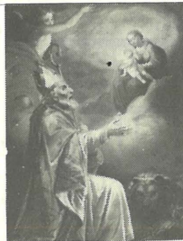
Pittura ta' G. Cali.

Kwadru ieħor mill-isbaħ ta' San Publju jinsab fuq l-artal ta' l-Oratorju tal-Fratellanza ta' l-istess qaddis fil-Furjana. Dan kien wieħed mix-xogħlijiet bikrin tal-pittur Ġuze' Cali' li lanqas nesa jdaħħal ix-xbieha ta' Publju fost il-kor tal-qaddisin fl-akbar pittura tiegħu fis-saqaf ta' San Franġisk ta' Putirjal fl-1907.