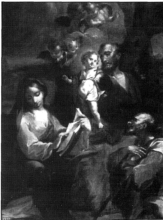
Il-kwadru ta' San Ġużepp fil-Parroċċa ta' San Pawl ir-Rabat

Din iż-żona fiha tahlita ta' irhula u bliet qodma. Insibu lokalitajiet kbar bħal Birkirkara u oħrajn żgħar bħall-Gudja. Id-devozzjoni ta' San Ġużepp tinsab fl-altari ta' dawn il-knejjes parrokkjali - Birkirkara (Santa Liena), Qormi (parroċċa San Ġorġ), Naxxar, Gudja, Mosta, Żebbuġ, Żejtun,