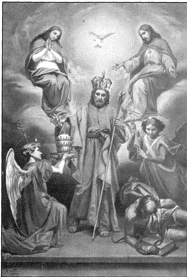
Il-kwadru titolari tal-Qala, xoghol Giuseppe Cali

Il-Hamrun ghandu altar iddedikat lil San