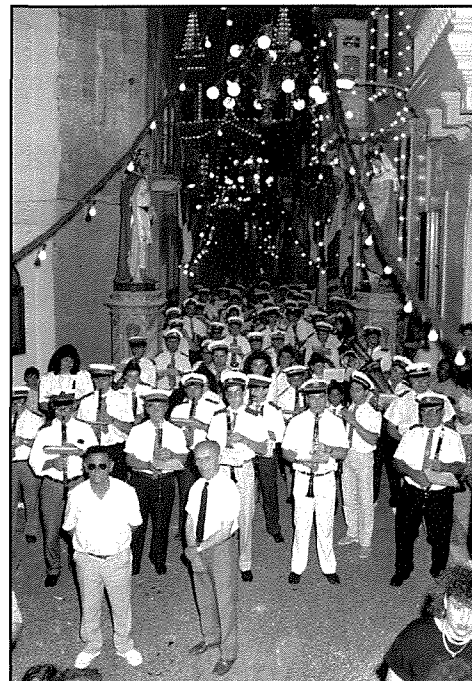
Il-Banda waqt wiehed mill-marċijiet tal- gimgha tal-festa.