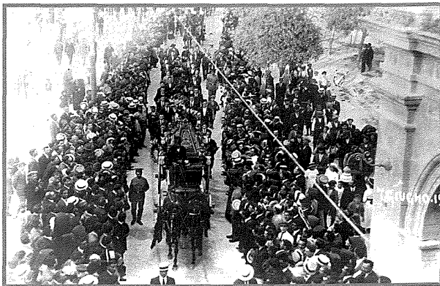
Il-folla tinġabar fil-Belt għall-irvellijiet tas-Sette Ġiugno u l-funeral tal-erba' vittmi