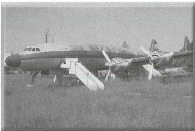
Il-Connie fi stat ta' telqa u abbandun.