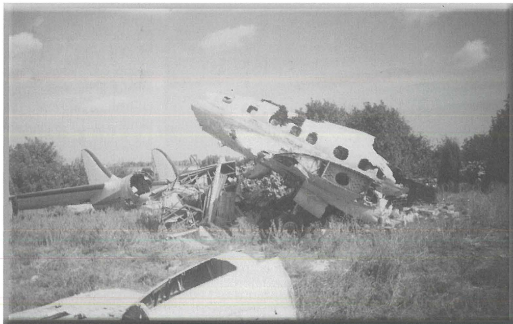
Il-fdal tas-Super Constellation wara li xi yandali tawh in-nar.

fl-aqwa tagħha, għax Connie femminili, iżda ajruplan għalina maskil) kien l-attrazzjoni principali, u kien jiġbed hafna nies, speċjalment turisti u delettanti tal-avjazzjoni. Isem Hal Kirkop, sab ismu fuq il-mappa ta' Malta, għalkemm isem Hal Kirkop kien qed jissema hafna minhabba li kien qed jinbena r-runway il-ġdid tal-ajruport internazzjonali ta' Malta, fejn bit-tajjeb u l-ħażin mijiet ta' tmien