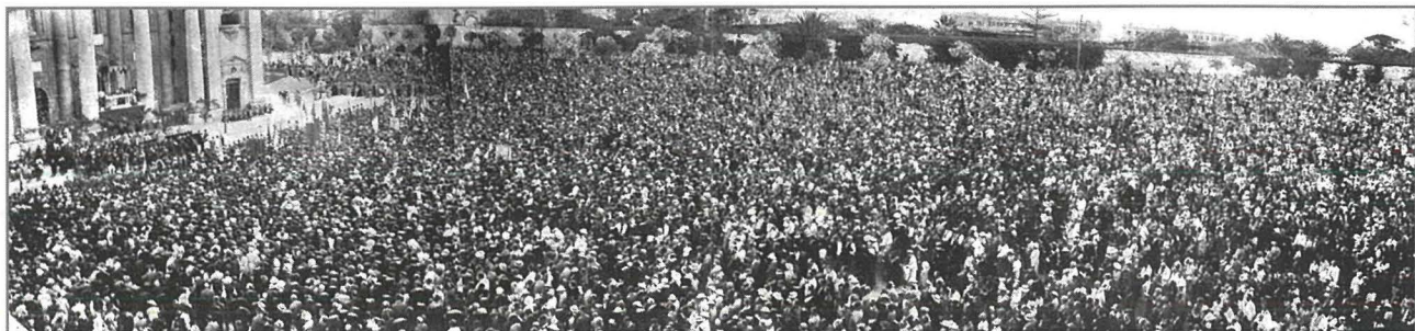
Il-Fosos tal-Furjana miżgħuda bl-insara jassistu għaċ-ċerimonja tal-Konsagrazzjoni tal-Gzejjer Maltin lill-Qalb Imqaddsa ta' Ġesù fj tmiem il-Konċilju.

Ċerimonja oħra solenni u maestuża ta' xejra reliġjuża temmet madwar għaxart'ijiem espressjoni qawwija tas-sentimenti Insara tal-poplu Malti li, ingħaqad mar-Rgħajja Spiritwali tiegħu u wera x-xewqa li kien jemmen bis-serjetà li jsehħ tiġdid fil-Knisja Maltija – ta' Malta u t'Għawdex –