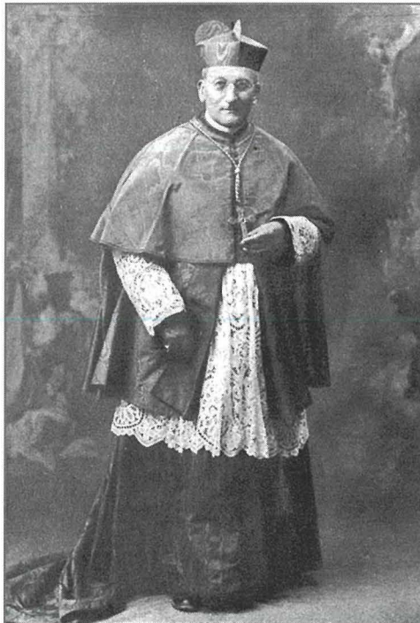
L'Eminenza Alessio Enrico M. Lepicier, Kardinal Legat tal-Papa li mexxa l-Konċilju Reġjonali tal-1935.

Għalija, u mhux neċessarjament kulhadd irid jaqbel miegħi, id-Dokument propost, żmienu għamlu u, għaldaqstant, ma naħsibx li hemm lok li wieħed joqgħod janalizza n-normi u l-proposti approvati fi tmiem il-Konċilju Reġjonali msemmi li sar 78 sena ilu. Madanakollu, inħoss li, xorta nista' nislet mid-Dokument, uħud min-normi, li