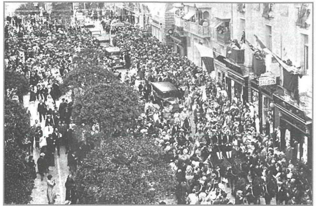
Sfilata ta' karozi diehla takkumpanja l-karozzella tal-Kardinal Lepicier fil-Belt Valletta.

lċ-ċerimonja ntemmet bil-Barka Papali mill-Kardinal A.E.M. Lépicier, li kif ħareg mill-Konkatedral ta' San Ġwann reġa' rikeb il-karrozella li wasslitu sal-Palazz tal-Isqof, fil-Belt stess, fejn kien se jkun residenti.