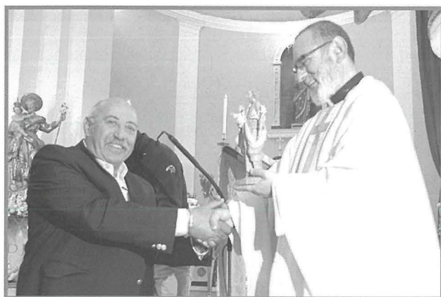
Padre Ignazio jagħti tifkira tal-okkażjoni lill-Fratellanza ta' San Ġużepp