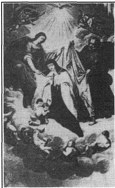
Il-kwadru titolari ta' Santa Tereza

Xieraq li nagħlqu din il-kitba billi nfakkru ġrajja li baqgħet tissemma. Fid-19 ta' Ottubru, 1837 kienet saret serqa sagrilega tas-sagrament minn din il-knisja. Is-sagrament kien instab jumejn wara, f'tit 'il bogħod mill-istess knisja, f'post li illum għadu magħruf bħala "fejn sabu s-Sinjur". Wara s-sejba kien anke sar mafkar biex tibqa' mfakkra din il-ġrajja.