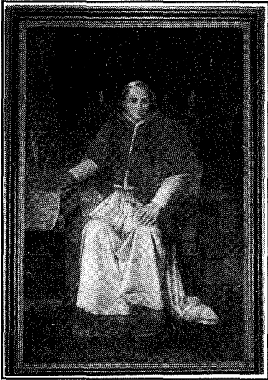
Il-Papa Piju VII

Il-Parroċċa ta' Bormla saret Kolleġġjata mill-Papa Piju VII f'Lulju 1822 175 sena ilu. F'dak iż-żmien l-aqwa unur li seta' jkollha parroċċa kien dak li ssir Kolleġġjata. Jekk inqallbu daqsxejn id-dokumenti li hemm fil-Kurja u fl-Arkivju Paġrokkjali ta' Bormla, insibu kemm hadmu u stinkaw il-Kleru u l-Poplu ta' Bormla biex jakkwistaw dan l-unur għall-parroċċa tagħna.