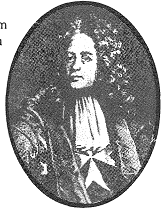
Il-Granmastru Antonio Zondadari li fost miżuri drastici li ha kien hemm il-bejgh ta' hafna mill-fided li kellha l-Ordni tal-Kavallieri.

Isem il-Granmastru Taljan Marc'Antonio Zondadari jibqa' għal dejjem marbut mal-"Belt Cospicua". Fil-fatt Zondadari, li laħaq Granmastru wara l-mewt ta' Perellos fl-1720 dam Granmastru sentejn biss u, li ma kienx għall-ghoti ta' dan it-titlu lil Bormla, ffit li xejn kien ihalli isem fl-Istorja ta' Malta. Fl-1720 kien hawn f'Bormla 660 dar, bi 3,000 ruh jghixu fihom. Dan in-numru ta' nies kien konsiderevoli għal dak iż-żmien, u l-Belt Valletta biss kienet tghaddi lil Bormla fin-numru ta' abitanti. Il-"motto" ta' Bormla "Ingens Amplectitur Agger" (Sur Kbir Idawwarni) jaqbel ma' l-isem li Zondadari ta lil Bormla. Fi żmien dan il-Granmastru, il-parti l-kbira tas-swar li jdawru lil Bormla kienet lesta. Fil-fatt fil-kitba mnaqqxa fuq Bieb Santa Liena, il-bieb ewlieni tas-Swar ta' Santa Margerita, jissemma s-sehem li Zondadari ta fil-bini ta' dawn is-swar.