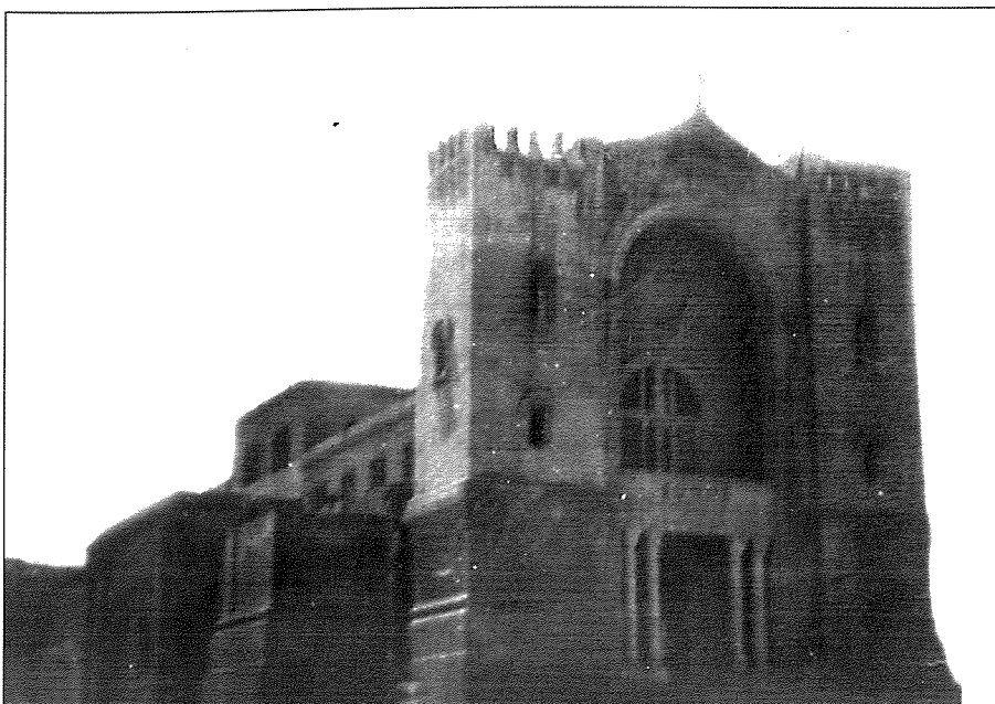
Il-knisja waqt il-bini tat-torrijiet fl-1947