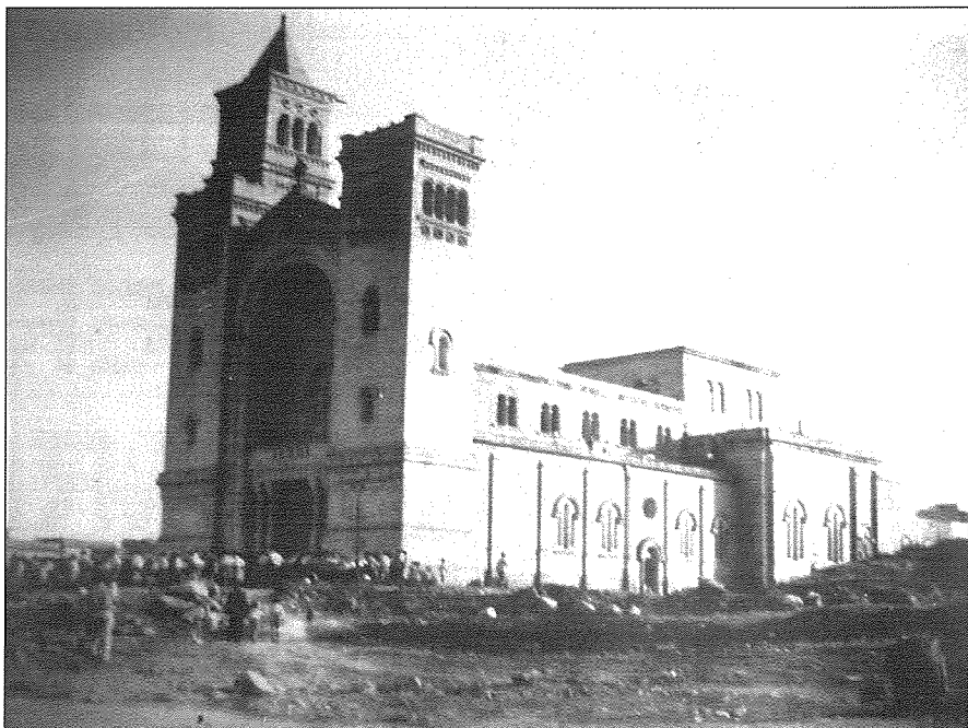
Ritratt tal-knisja hekk kif tlesta l-bini fuqha fl-1951

Ix-xogħol kien għaddej b'ritmu mgħaġġel bil-ħsieb li jsaqqfu l-korsija halli b'hekk il-knisja tkun tista' tintuza kollha. Hekk kif tlestew il-ħitan u l-ħnejjiet tan-navi, inħadmu it-travi tas-saqaf il-kbir u kien se jibda x-xogħol sabiex dawn isibu posthom. Gara li nhar 10 ta' Ġunju tal-1940, il-mexxej Taljan Benito Mussolini ddikjara gwerra mal-Gran Brittanja u dan kien ifisser li Malta kienet daħlet fil-gwerra. L-ghada seħħ l-ewwel attakk mill-ajru fuq Malta, fejn l-ewwel bombi nżergħu propju fuq Kalafrana. Birżebbuġa giet evakwata min-nies minħabba li kienet fil-qalba tat-tigrib. Il-gwerra holqot ostaklu kbir fil-bini tal-knisja tant li bejn Ġunju tal-1941 u Settembru tal-1944 ix-xogħol kien waqaf kompletament. Ghalkemm diversi djar madwar il-knisja ġew imgarrfa, l-bini tal-knisja soffra biss ħsarat minimi.