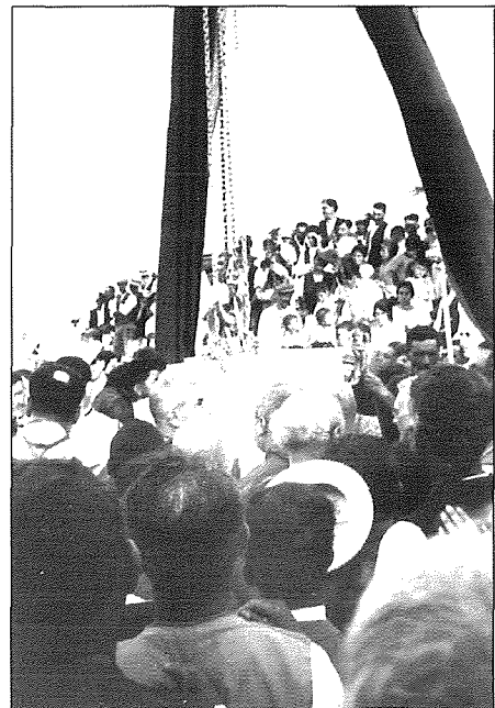
Il-mument tat-tqeghid tal-ewwel ġebli.

Hekk kif ġiet imqiegħda l-ewwel ġebli, beda x-xogħol fuq il-bini. L-ewwel ma beda jinbena kien il-kor. Jidher li għall-bidu l-bini inbeda fuq il-ħitan ta' barra tad-dawra kollha tal-knisja, biss meta waslu fl-gholi ta' madwar sular u nofs iddecidew li jkun aħjar li jibdedw jibnu l-knisja minn wara u jibqgħu mexjin bil-bini lejn il-faccata. Għalhekk l-ewwel ma nbnet kienet id-dar parrokkjali li tinsab