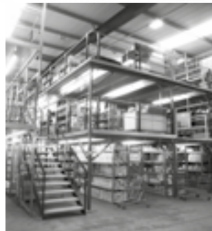
TWO TIER RACKING