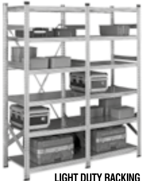
LIGHT DUTY RACKING