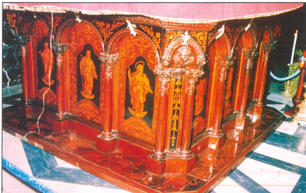
Il-bradella tal-Kunċizzjoni minn wara.