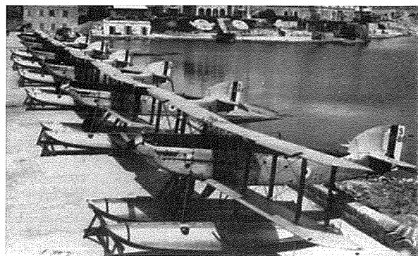
Kalafrana 202 squadron

Minn Kalafrana dawn l-ajruplani kienu jmorru lejn id-direzzjoni tal-Bajja ta' San Ġorġ, minn fejn minn hemm kienu jieħdu rankatura fid-direzzjoni tal-bokka wiesgħa tal-port, sakemm jinqatgħu mill-ilma lejn is-sema miftuħ. Kien inbena wkoll moll tal-injam sabiex jintuża għat-tluġ u l-inżul tan-nies fuq l-ajruplani, li darba kien tkisser bil-maltemp u l-fallakki tiegħu spicċaw kollha max-xtajta ta' Wied il-Buni. Għalkemm il-bajja kienet kennija, però meta r-riħ kien ikun mix-xlokk, kien jagħmilha ferm diffiċli sabiex dawn l-ajruplani jagħmlu t-tluġ jew l-inżul tagħhom, u għalhekk f'ċerti okkażjonijiet kienet tintuża l-bajja tal-Mistra. Irridu ngħidu ukoll li b'riżultat ta' dan l-iżvilupp, f'Kalafrana u l-inħawi tal-madwar, inkluż Birżebbuġa, kien hemm attività ekonomika kbira fejn mhux biss inholqu diversi postijiet tax-xogħol għall-Maltin, imma anke xogħol ieħor bħal ma huma l-ħwienet tax-xorb, l-imħażen privati tal-ħasil tal-ħwejjeg, xufiera u bosta oħrajn.