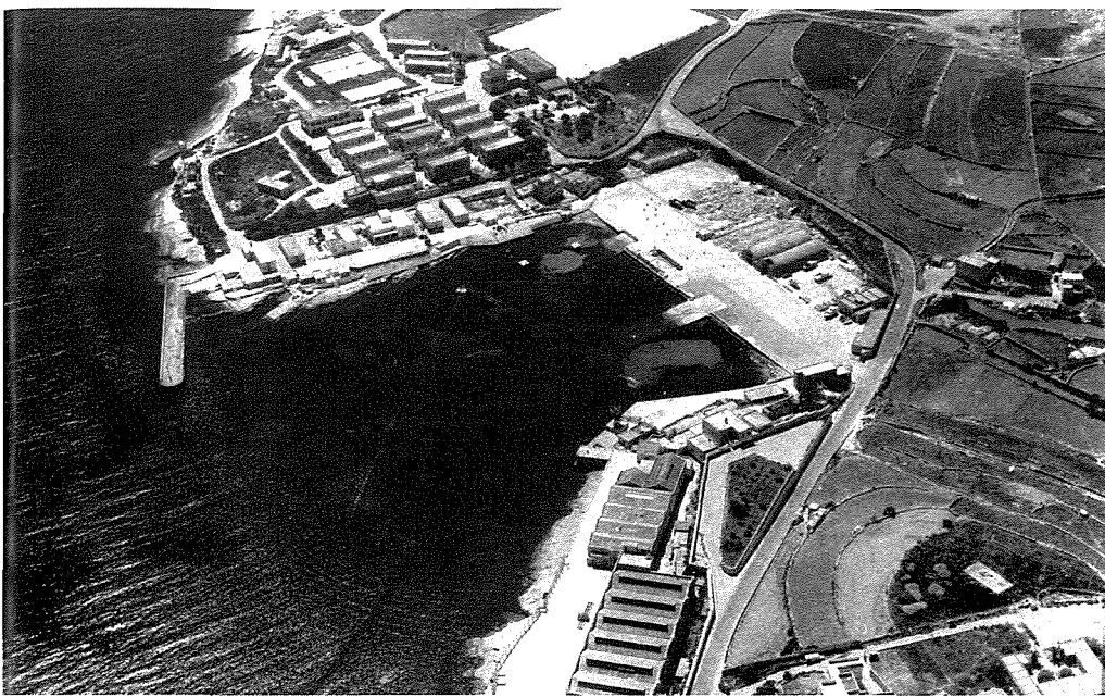
Kalafrana - South Slip

Adolf Hitler bħala l-mexxej tal-Ġermanja fl-aħhar jiem ta' l-istess gwerra fl-1945. Nistgħu nżidu wkoll illi matul l-Ewwel Gwerra Dinjija, Malta u l-poplu tagħha gawdew minn tkabbir fl-ekonomija peress li gżirna kienet tiddependi għal kollox fuq il-gwerer tal-Imperu Ngliz għall-għajxien tagħha. Fil-fatt, meta spicċat il-gwerra, dan kollu ġie fix-xejn u f'Malta kien irregistrat qgħad u faqar kbir.